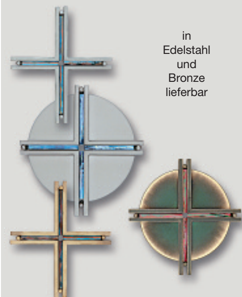
in Edelstahl und Bronze lieferbar

Kunstwerkstätte Gerhard Gröters GM BH GRABSCHMUCK • SCHRIFTEN ALU • BRONZE • EDELSTAHL Bollenwaldstr. 107 • 63743 Aschaffenburg Telefon (0 60 28) 72 57 und 99 14 0 Fax (0 60 28) 39 52 und 99 21 35