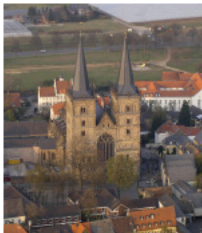
Der Xantener Dom ist in mehrfacher Hinsicht ein herausragendes Gebäude. Mit einer Höhe und einer Länge von ca. 70 m und einer Breite von ca. 40 m gehört er zu den größten Sakralbauten Nordrhein-Westfalens.