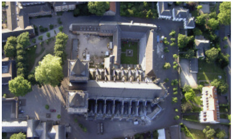
Die fünfschiffige Basilika mit der doppel-türmigen Westfront von oben. Links oben befinden sich neben dem Kreuzgang der Gebäudetrakt und Lagerplatz der Dombauhütte.