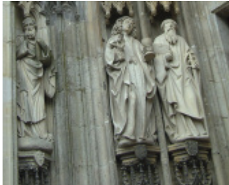
Die spät- und neugotischen Figuren am Südportal wurden durch Abgüsse ersetzt.

Denkmalpflege.« Die Freiheit der Dombauhütte, keinen Gewinn erzielen zu müssen, nutzt sie, um als neutraler Partner mit unterschiedlichen Herstellern zu kooperieren. Von den Ergebnissen der Testreihen mit Probemischungen und Fremdprodukten gewinnen schließlich beide Seiten wichtige Impulse. »Wir stehen auch in der Kritik. Es wird Aufklärung erwartet«, begründet Schubert außerdem seine Bereitschaft zur Information. Die Öffentlichkeit soll erfahren, was in der Bauhütte passiert, wofür die Gel-