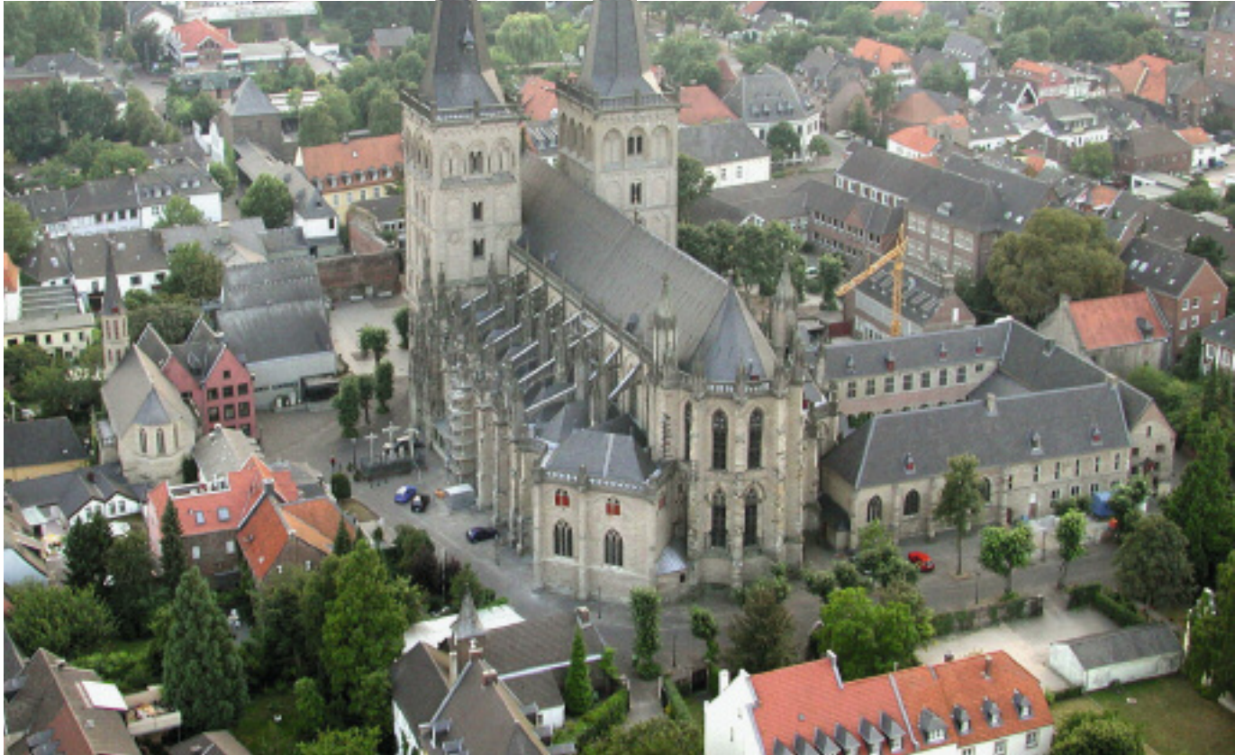
Der Xantener St.-Viktor-Dom wurde noch im ausgehenden Mittelalter vollendet.