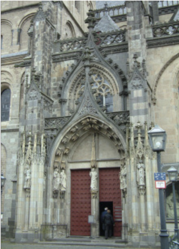
Am Südportal mussten bis 1997 hunderte von Teilen neu geschaffen werden.