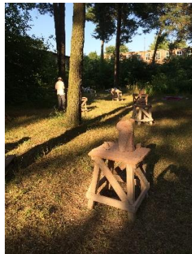
Der Garten des Atelierhauses Potsdam/Stadtgrenze Berlin