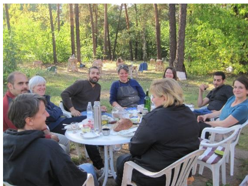
Bildhauerworkshop Plastisches Gestalten mit Stein Potsdam/Stadtgrenze Berlin 2016

Übernachtungsmöglichkeit: z.B. in Pension Landleben am Sacrower See oder einfaches Appartement in Seeburg.