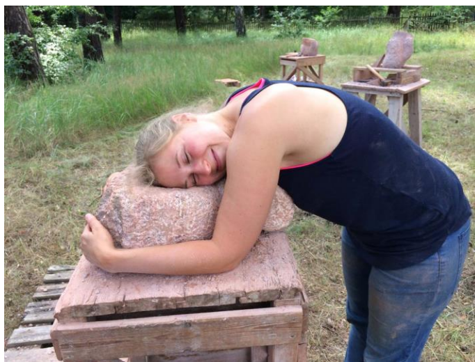
Plastisches Gestalten mit Stein, Potsdam/ Stadtgrenze Berlin 2015

Wie wird das Schwere leicht? Wie wird das Harte weich? Wie finde ich meine Form? Der Bildhauerworkshop bietet eine erlebnisreiche Zeit, die die Begegnung mit dir selbst, dem Stein und den anderen in der Gruppe ermöglicht.