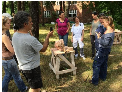
Bildhauerworkshop Plastisches Gestalten mit Stein Potsdam/Stadtgrenze Berlin

Kosten: 4 Tage 360 € / ermäßigt 330 € inklusive Material und Werkzeuge. Frühbucherrabatt 20 € bei Anmeldung bis 30.1.2019