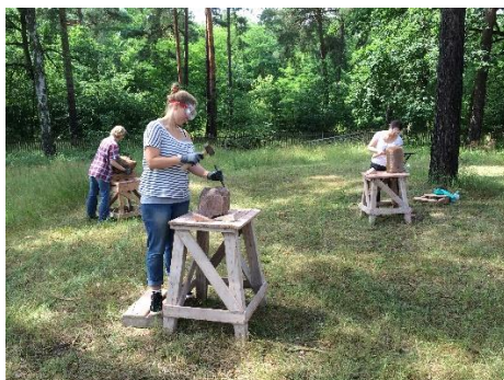
Plastisches Gestalten mit Stein Potsdam/Stadtgrenze Berlin 2017

Verpflegung: gemeinsames Picknick auf dem Gelände oder bei Regen im Atelierhaus Panzerhalle