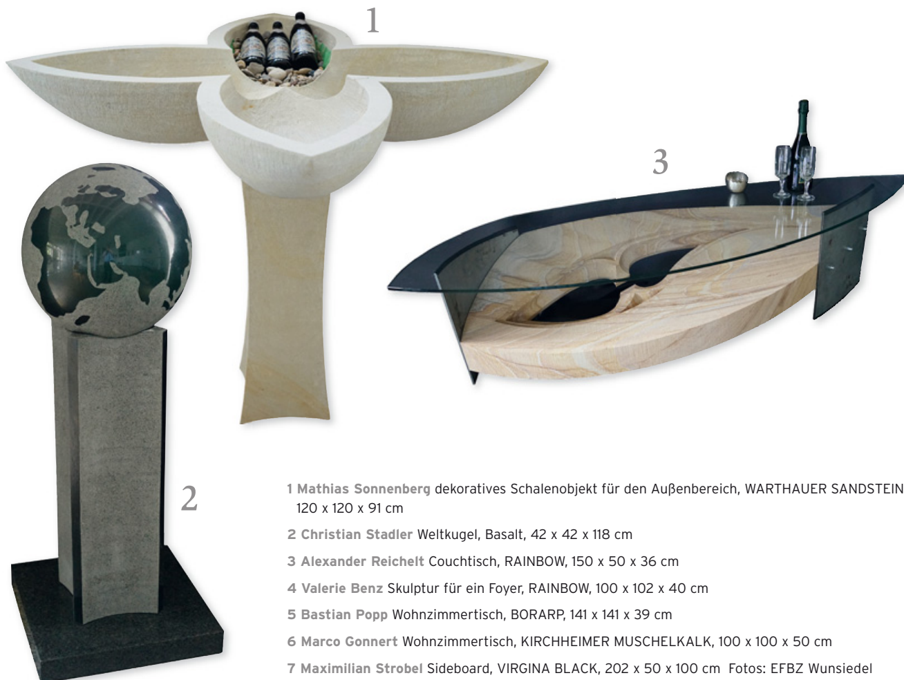
1 Mathias Sonnenberg dekoratives Schalenobjekt für den Außenbereich, WARTHAUER SANDSTEIN, 120 x 120 x 91 cm

hat von 2007 bis 2014 in den Bereichen Konservierung, Restaurierung und Denkmalpflege studiert und dabei einen Diplom- und einen Master-Abschluss erworben. Seit 2014 ist sie als freiberufliche Restauratorin tätig und seit 2015 als Mitarbeiterin am Europäischen Fortbildungszentrum in Wunsiedel. Außerdem absolvierte sie 2015/2016 die Weiterbildung zur Restauratorin im Steinmetz- und Steinbildhauerhandwerk.