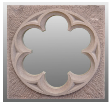
Ingo Kühn Sechspass, 110 cm x 110 cm x 11,5 cm, ROTER EIFELSANDSTEIN