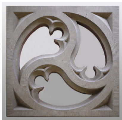
Christian Homolla »Dreiteilige Fischblase«, 100 cm x 100 cm x 12 cm, ROTER EIFELSANDSTEIN