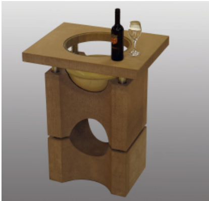
Steffen Diehl Stehtisch, 75 cm x 60 cm x 110 cm, Becken französischer Kalkstein, Fuß und Platte ROTER EIFELSANDSTEIN