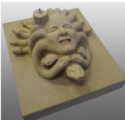
Jannik Heß Medusa, 64 cm x 54 cm x 35 cm, HEILBRONNER SANDSTEIN