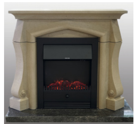
Sascha Weller Kaminumrandung, 83 cm x 95 cm x 26 cm, PFAFFENHOFENER SANDSTEIN