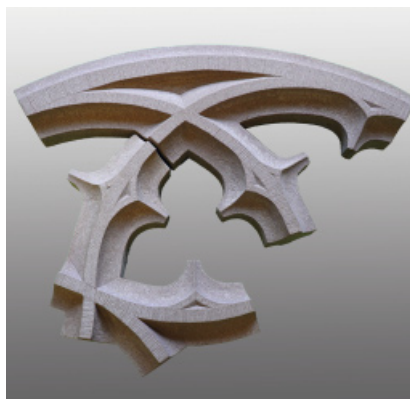
Lukas Hagner Gotisches Maßwerk, zwei Teile, 68 cm x 38 cm x 12 cm (o.), 42 cm x 40 cm x 12 cm (u.), ROTER EIFELSANDSTEIN