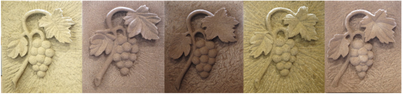
Bildhauerarbeitsprobe: Weinranke, 8 Stunden Arbeitszeit, v. I. S. Weller, S. Diehl, L. Hagner, C. Homolla und I. Kühn