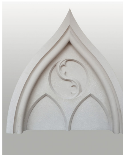
Walter Segbers »Gotischer Eselsrücken«, RACKWITZER SANDSTEIN