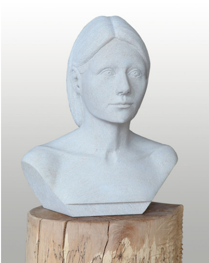
Lorenz Rosenberger »Das Porträt«, HANBRUCHER SANDSTEIN