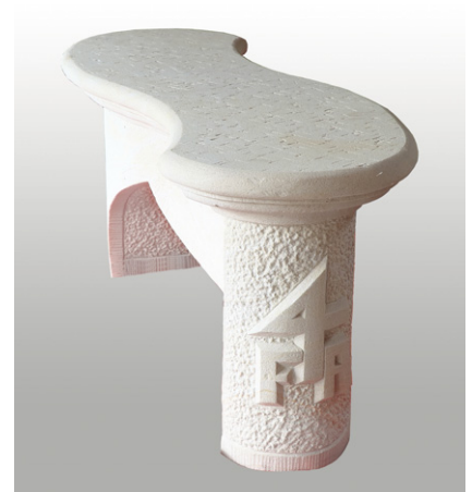
Fabian Aumüller Gartensitzbank, WARTHAUER SANDSTEIN