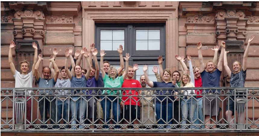
Jubeln vor Freude: 15 Prüflinge absolvierten erfolgreich die Meisterprüfung in Aschaffenburg.

hat Kunst und Germanistik studiert. Zehn Jahre war sie Bildungsreferentin beim bbw. Seit 2000 leitet sie die Meisterschule in Aschaffenburg.