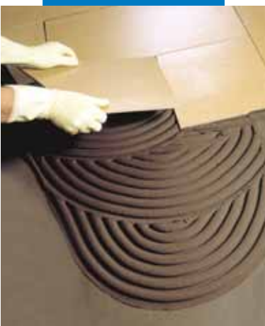
Verlegung von Feinsteinzeug auf einem mit Mapelastic abgedichteten Estrich