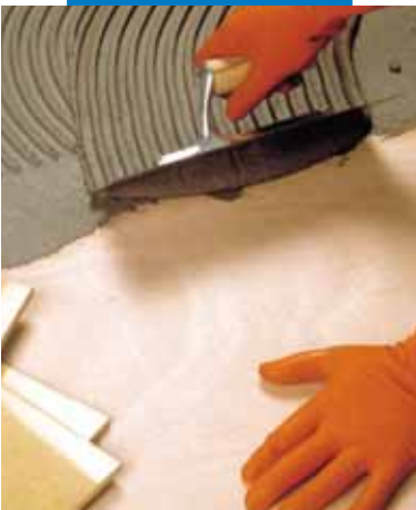
Verlegung von Feinsteinzeug mit Elastorapid