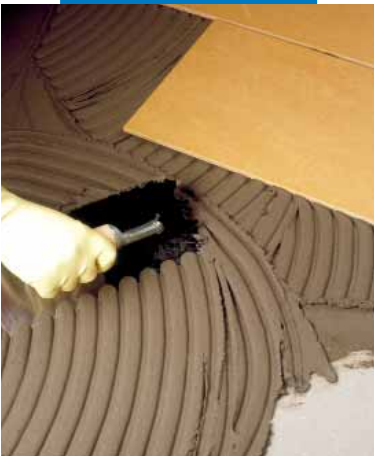
Verarbeiten von Elastorapid mittels Zahnkelle

Mit Elastorapid verlegte Beläge sind bereits nach 3 Stunden begehbar und nach