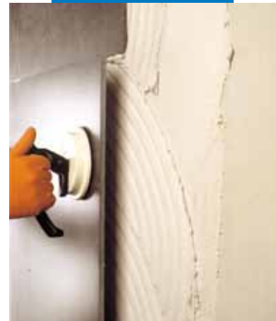
Ansetzen von großformatigem Feinsteinzeug an einer Betonwand