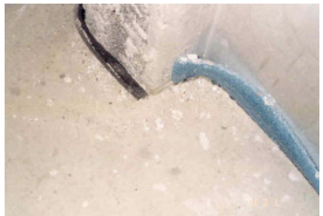
Schallbrücke: fehlender Randdämmstreifen