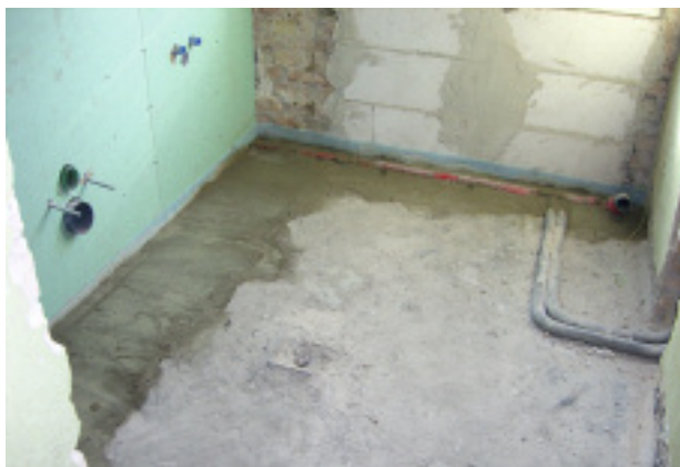
Schallbrücke durch Leitungen auf der Rohdecke

Die Prüfung der erreichbaren Trittschalldämmung erfolgt nach DIN 52210 (»Bauakustische Prüfungen; Luft- und Trittschalldämmung«) bzw. der europäischen Norm DIN EN ISO 140 Teil 6 (»Akustik-Messung der Schalldämmung in Gebäuden und von Bauteilen – Messung der Trittschalldämmung von Decken in Prüf-