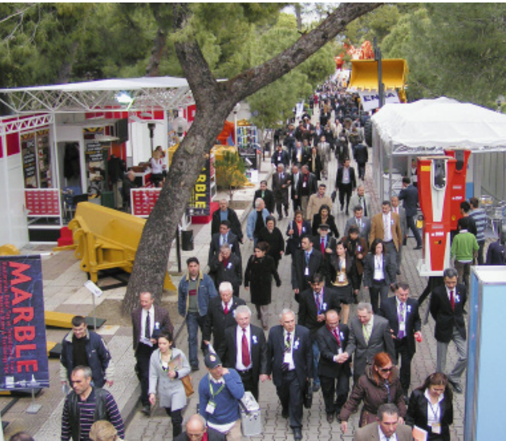
Einiges los: Besucher auf der Izmir-Messe

waren hauptsächlich Unternehmen, die bereits mit türkischem Naturstein handeln. Laut Örs Gülümcan von der Messegesellschaft IZ-FAS wird auf der Stone + tec (Halle 5, Stand 137) für die nächste IZMIR-Messe geworben, um das Interesse in Deutschland zu steigern (Kontakt: Örs Gülümcan, Tel. 0090/2324971229, www.izfas.com.tr ).