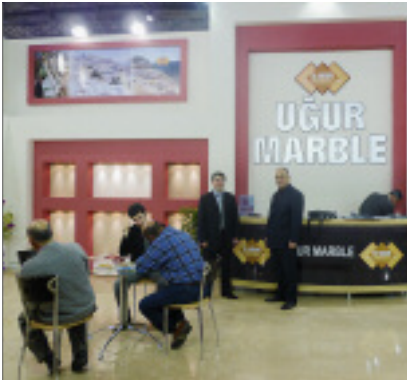
Die Firma Uğur lieferte Material für das »teuerste Haus der Welt«.