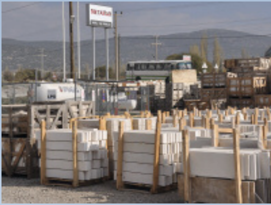
Firmengelände von Metamar