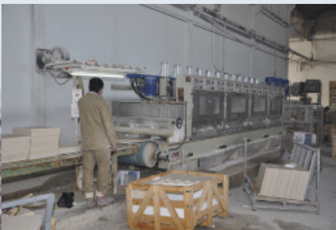
Fliesenproduktion in Isparta