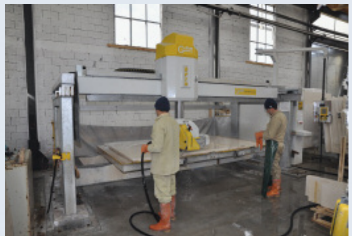
Metamar fertigt mit modernen Maschinen und Anlagen, die zum größten Teil aus Italien stammen.