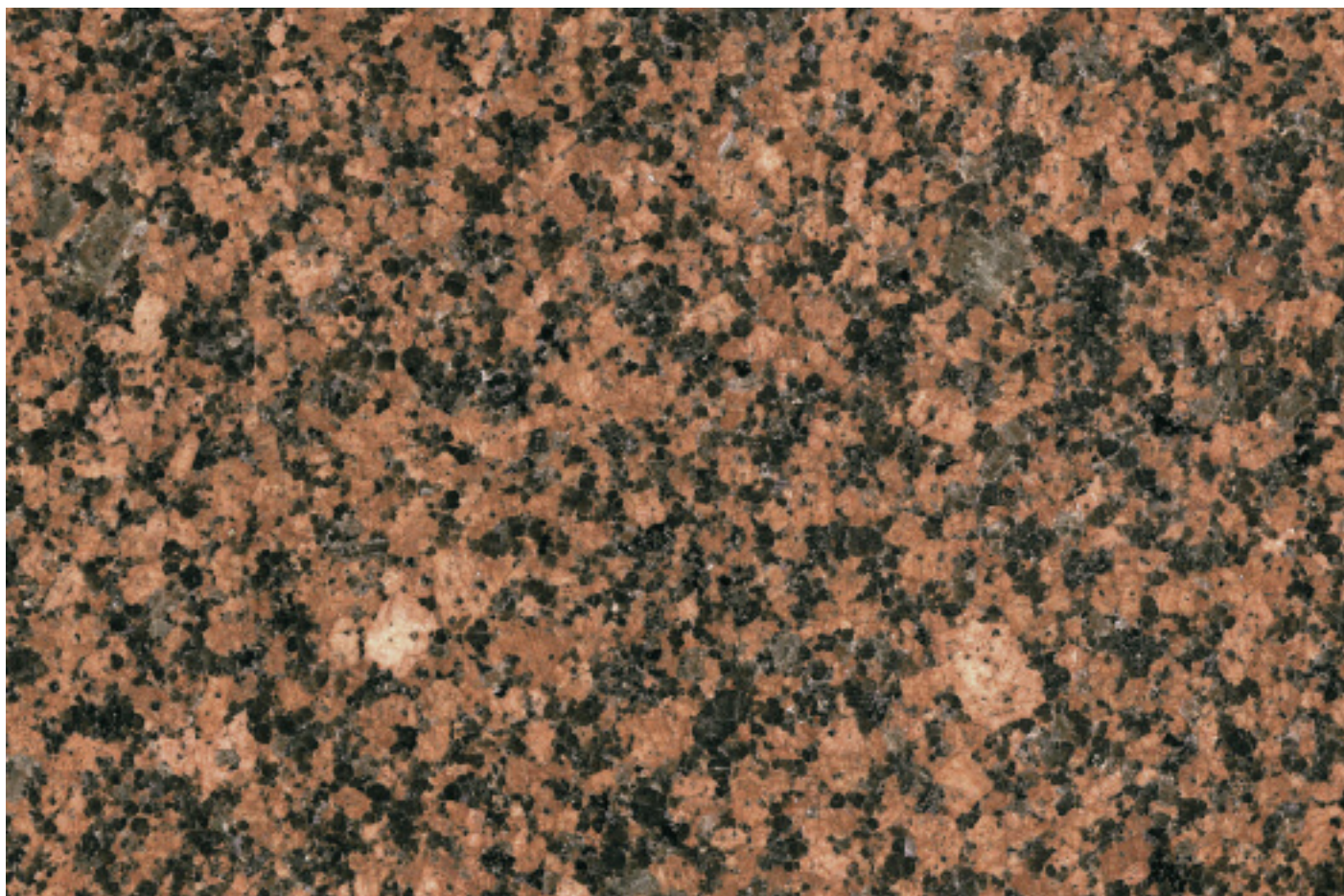
Granit NEW BALMORAL