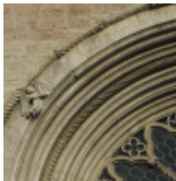
Detailansicht der Kathedrale von Trento