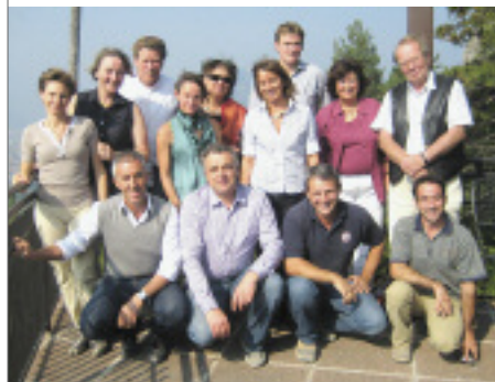
Teilnehmer und Organisatoren

Die diesjährige Themenstellung »Hybrid and Flexible« war nicht zuletzt als Anstoß gedacht, im Schatten der Krise die Zukunft neu zu definieren: Innovation im Umgang mit Naturstein war gefragt. Die Messestände, die im Zeichen dieser Aufforderung entstanden, haben eines gemeinsam: Designer und Unternehmer haben dem Naturstein ihre Reverenz erwiesen. Lange Zeit wurden sie vernachlässigt – jetzt werden die haptischen und optischen Eigenschaften dieses traditionsreichen Baustoffs in den Vordergrund gerückt – unübersehbar dabei Zitate aus den 60ern als Op-Art-Hommage. Wandbekleidungen mit Flachreliefs, die Licht- und Schatten-Spiele inszenieren, Raumteiler, die dem Stein seine Dreidimensionalität zurückgeben und dennoch filigran wirken, Sitzmöbel, deren weiche Linienführung das Gefühl erweckt, die Natur habe die Hand im Spiel gehabt – die Teilnehmer der Studienreise erlebten diese Beiträge als Quelle der Inspiration. Mit, wie es schien, spielerischer Leichtigkeit entwarf Patricia Urquiola für Budri