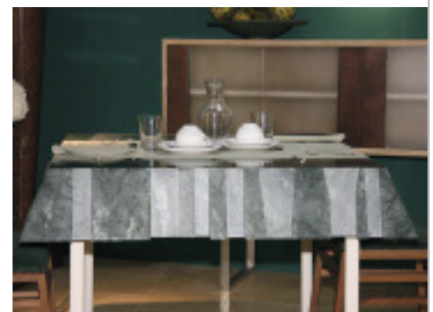
»Veroneser Gastfreundschaft«: Tischdecke aus Stein