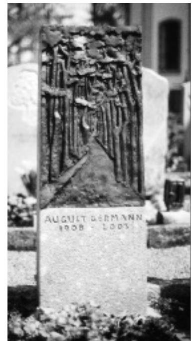
Roman Brunswiler, Gossau, Grabmal für einen Spaziergänger, Vert des Glacières/Bronze, 110 x 46 x 16 cm, Friedhof Waldkirch

gelte. Das Grabmal zeigt einen Vogel, »der tatsächlich zu schweben scheint«, bemerkte die Jury. Klassisch und dennoch innovativ, sei dies ein Grabzeichen »ohne Wenn und Aber«. Der Übergang vom Boden zum Himmel sei gut gelöst, die frei gestaltete Inschrift am richtigen Ort platziert.