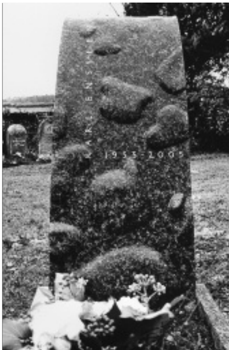
Jürg Stäheli, Stein am Rhein, Grabmal für einen Physiker, Poschiavo Serpentin, 110 x 20 x 50 cm