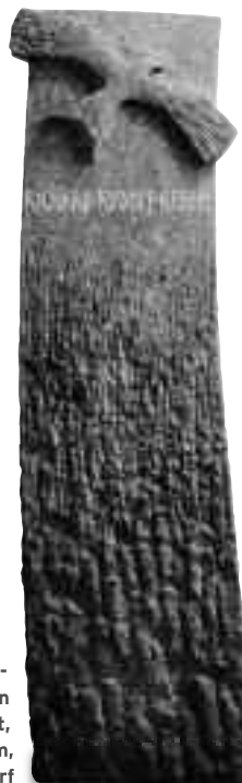
Horst Bohnet, Regensdorf, Grabmal für einen Vogelfreund, Rotbasalt, 90 x 30 x 12 cm, Friedhof Regensdorf

Am oberen Rand des Grabsteins schweift der Blick in eine scheinbar unendliche Ferne. Im Hinblick auf den Beruf des Verstorbenen können die Erhebungen aber auch als Teilchen oder als etwas Mikroskopisches interpretiert werden. Handwerklich und gestalterisch sei dies »eine Meisterleistung«, entschied die Jury. »Die wohlproportionierten Inseln – von unten nach oben abnehmend in der Masse – geben dem Ganzen die gewünschte Tiefe sowie eine Leichtigkeit, Unbeschwertheit.« Trotz der Masse des Steins und seiner dunklen Farbe, wirkt er leicht, weil sich das Grabmal nach oben verjüngt und eine Rundung nach hinten auf-