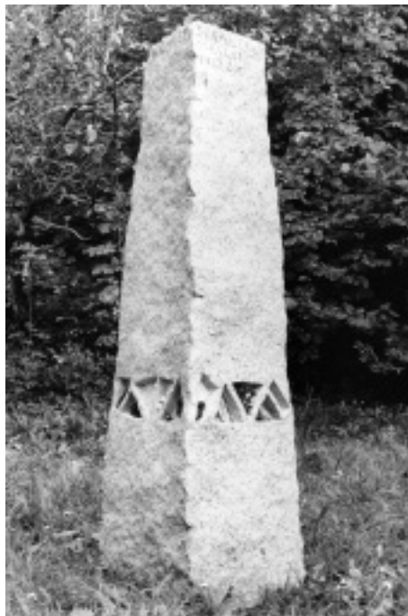
Urs Traber/Sibylle Obrecht, Steckborn, Grabmal aus Aaregranit, 115 x 38 x 28 cm, Friedhof Nussbaumen