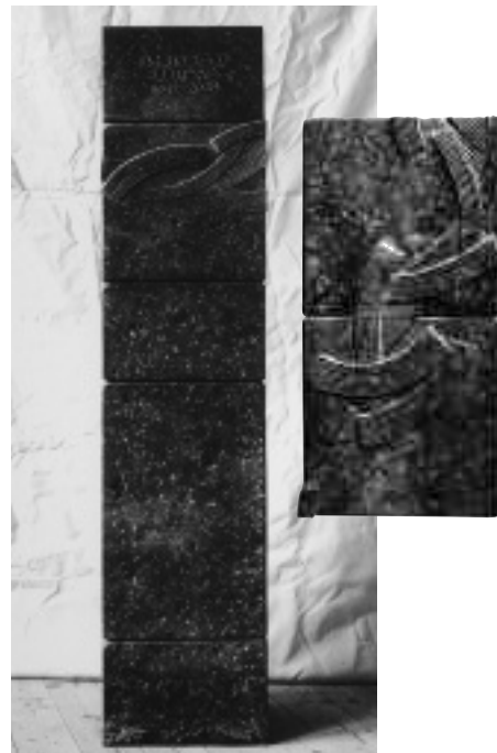
Gabor Hrusovszky, Zürich, Urnen-Grabmal für einen Künstler, Diabas, 120 x 28 x 28 cm, Friedhof Rehalp