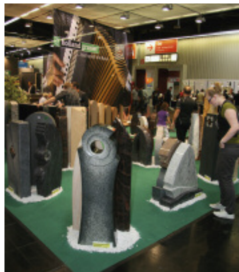
Stand der Firma Holland Graniet auf der Stone+tec