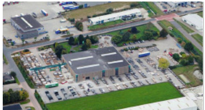
Firmensitz in Stadskanaal