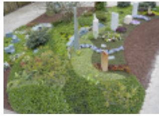
Im Memoriam-Garten bildeten Gräber und Bepflanzung eine Einheit.

Nach Angaben der Beteiligten handelt es sich bei dem Modellprojekt um ein modernes Konzept mit Zukunftspotential, das auf jedem Friedhof umgesetzt werden kann, einen festen Anlaufpunkt für Trauerrituale bietet und sich als Alternative zu anonymen Bestattungen etablieren soll. Es richtet sich u. a. an Hinterbliebene, die keine Grabpflege übernehmen wollen bzw. können. Für einen Fixbe-