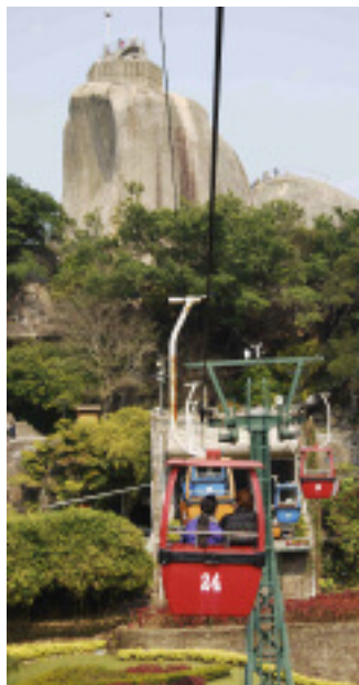
Xiamen hat auch touristisch Einiges zu bieten.

Kontakt: Xiamen Jinhongxin Exhibition Co. Ltd. Tel: 0086/592/59596-16,-18 Fax: 0086/592/5959611 www.stonefair.org.cn