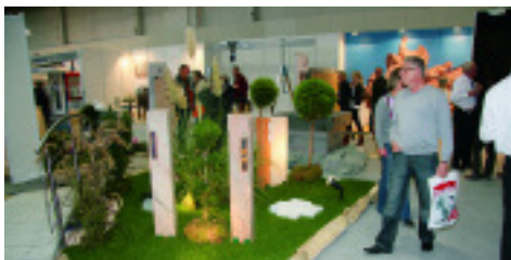
Fand beste Resonanz: das Forum Naturstein auf der Verbrauchermesse Infra in Hannover