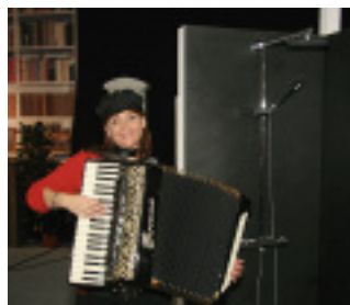
Da war Musik drin: 23 Betriebe der Innung Hannover begeisterten Besucher auf der Infra in Hannover.