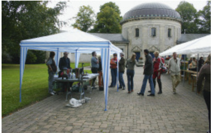
Eine schöne Kulisse für die Veranstaltung bot die Friedhofskapelle auf dem Krefelder Friedhof.

fand ebenso großen Zuspruch wie die neu erstellten Urnengemeinschaftsanlagen. Den Höhepunkt stellte ein »Kreuzweg« mit neun Stationen dar, der u. a. bearbeitete Sandsteinquader mit symbolischer Bepflanzung zeigte. Darüber hinaus verteilten Steinmetze, die Genossenschaft der Friedhofsgärtner eG, das Katholische Zentrum der Trauerseelsorge und eine Künstlerin eine Kreuz-Christi-Darstellung aus »LebKuchen« an die Besucher. Aufgrund der positiven Resonanz der Besucher wird der »Tag des Friedhofs« in Frankfurt ein wichtiger Bestandteil der Darstellung des Steinmetzhandwerkes und der Friedhofskultur bleiben, sind die Organisatoren überzeugt.