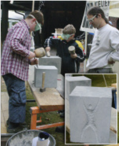
In der Lebenden Werkstatt auf dem Friedhof Kaldenkirchen wurde ein »Menschenturm« gestaltet.