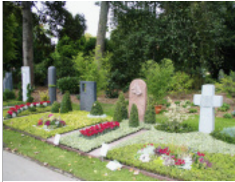
30 Mustergräber hatten Steinmetze und Gärtner auf dem Düsseldorfer Friedhof angelegt.

Viele tausend Besucher informierten sich am 20. September bei über 20 beteiligten Organisationen auf dem Hauptfriedhof in