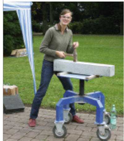
Auch der Nachwuchs zeigte auf dem Krefelder Friedhof sein Können.

»Orte, die gut tun« – unter diesem Motto stand der »Tag des Friedhofs« am 12. September in Lübeck-Kücknitz. Bewusst lehnten sich die Organisatoren an den Leitspruch der Sonderpräsentation auf