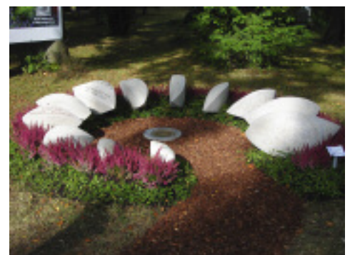
Urnengrabanlage »Wie Blätter im Wind« aus Muschelkalk von Christiane Hellmich