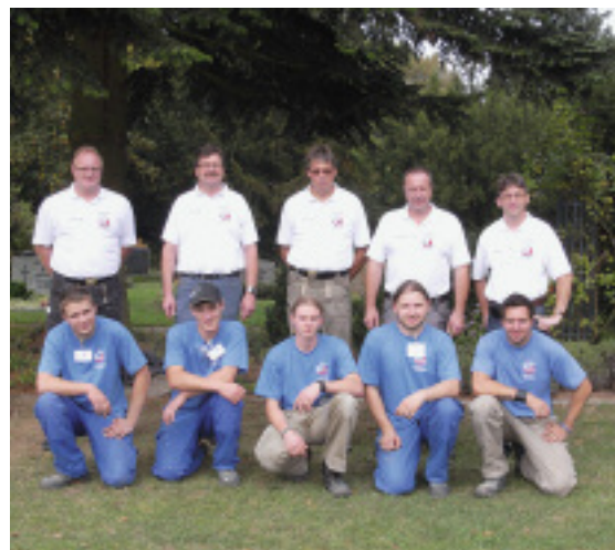
Die Teilnehmer am Lehrlings-symposium in Wetzlar

Außerdem fanden Führungen über den Neuen Friedhof und eine Besichtigung des Ulmer Krematoriums statt.