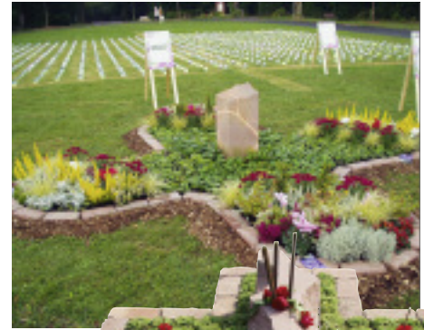
Zwei der neun Stationen des sog. »Kreuzwegs« auf dem Hauptfriedhof in Frankfurt am Main

Frankfurt am Main. Der von zehn Kollegen der Steinmetzzinnung Hessen-Mitte, Bezirk Frankfurt, betreute Stand mit großem Zelt, zeigte die Vielfältigkeit des Steinmetzhandwerks, u. a. in Form von einer Kindersteinmetzhütte, Themen- und Mustergräbern sowie Informationen über Symbolik und Grabmalvorsorge. Die Live-Vorführung »Versetzen eines Grabsteines« vom Rasenstück bis zum fertigen Grab