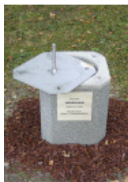
Beton-Fundamentröhre aus dem Konzept »Urnenhain«