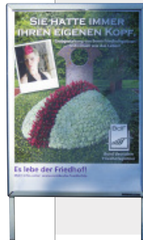
Kampagnenmotiv des BdF

Geschichte unseres Berufsstandes«. Laut Roland Wagner, Marketingverantwortlichem des BdF, gelingt der Aktion die Gratwanderung zwischen Provokation und Wahrung der erforderlichen Pietät. Weitere Informationen zur Kampagne finden Sie unter www.es-lebe-der-friedhof.de