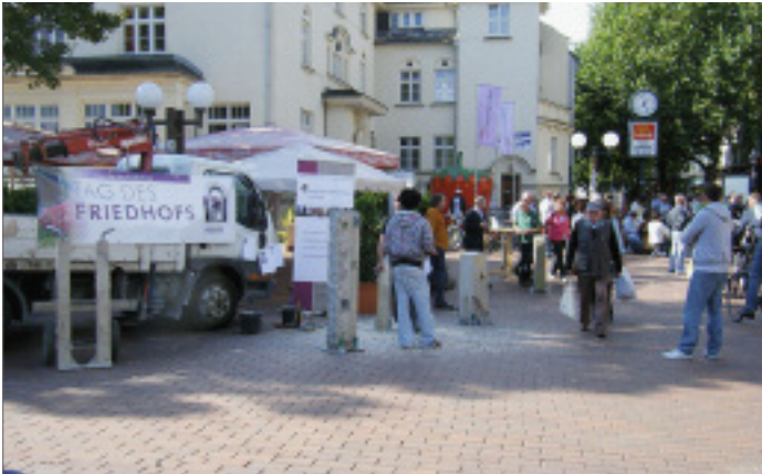
Der »Tag des Friedhofs« fand auch mitten in der Hamburger Fußgängerzone statt.