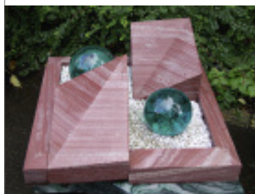
Pflegeleichte Urnengrabgestaltung aus Wasa-Quarzit von August Weber