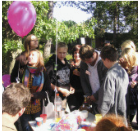
Junge Leute auf dem Friedhof Waldhusen verschickten ihren »Gruß nach oben«.