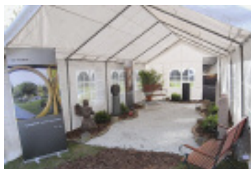
Das »Zelt der Besinnung« auf dem neuen Wetzlaer Friedhof