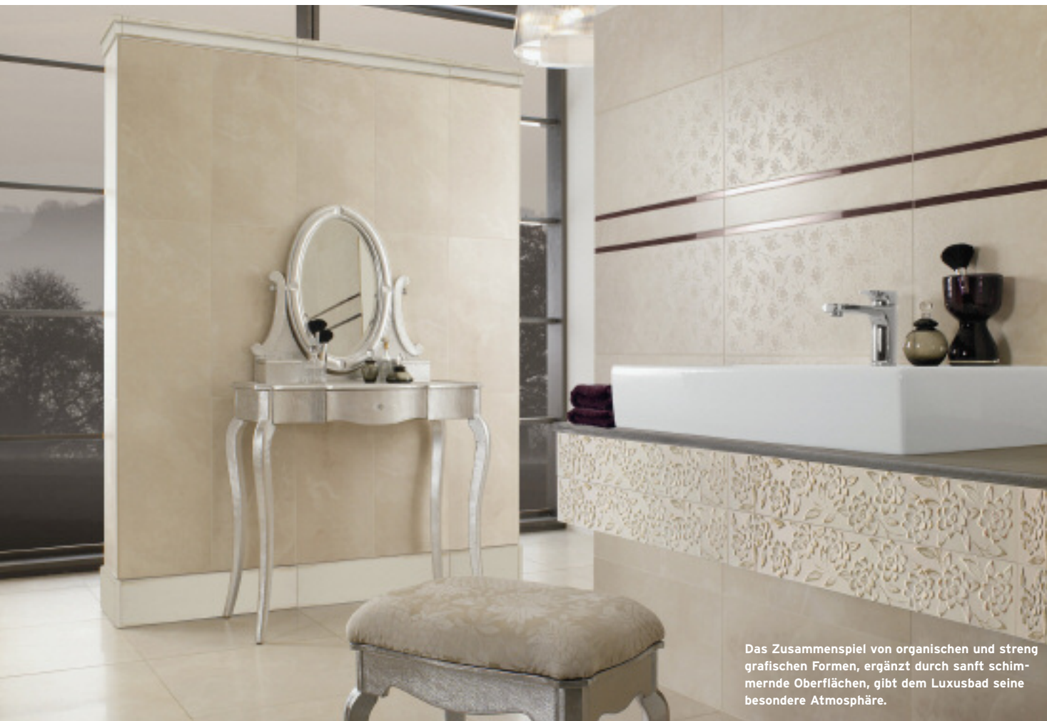
Das Zusammenspiel von organischen und streng grafischen Formen, ergänzt durch sanft schimmernde Oberflächen, gibt dem Luxusbad seine besondere Atmosphäre.