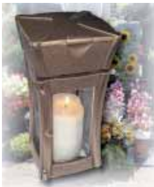
Die erste Grablaterne mit integriertem Weihwasserkessel

Eine neu entwickelte Grablaterne mit integriertem Weihwasserkessel eignet sich besonders gut für Urnengräber, auf denen wenig Platz vorhanden ist. Ihr Erfinder, Manfred Lehner aus Westerstetten, nennt weitere Vorteile: »Dadurch, dass der Weihwasserkessel erhöht auf der Laterne positioniert ist, müssen sich ältere Leute nicht mehr so tief bücken, um den Behälter zu füllen.« Darüber hinaus friere im Winter das Weihwasser nicht mehr ein; die Wasserverdunstung werde durch große Lüftungsschlitze sowie eine ausgeklügelte Luftführung reduziert.