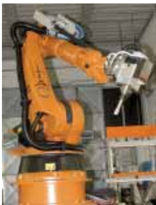
Der Roboter »QD STONE MILL«, für die Weha die Vertretung im deutschsprachigen Raum übernommen hat.

Am 27. und 28. November veranstaltet die Weha Ludwig Werwein GmbH aus Königsbrunn wieder ihre alljährlichen Infotage. Präsentiert werden u. a. neue Maschinen wie die Donatoni-Brückensäge RD 825 für Blattdurchmesser bis zu 825 mm, drei Brückensägenmodelle für unterschiedlichste Anforderungen, neue Werkzeuge und Fahrzeuge sowie aktuelles Zubehör. In Funktion können u. a. die Commandulli-Kantenschleifmaschine SPIRA für die Herstellung von u. a. Kanten mit gerundeten Fasen, das InterMac-Bearbeitungszentrum Master 33 und - als ein Highlight der Hausmesse - der Roboter »QD STONE MILL« besichtigt werden. Für das Gerät des Augsburger Herstellers Kuka hat Weha im deutschsprachigen Raum die Vertretung übernommen. Die Roboterarme werden in vielen Branchen eingesetzt, in denen höchste Präzision, maximale Flexibilität und maximale Automatisierung erreicht werden müssen. In der Steinindustrie werden Geräte mit einer speziellen Ausbaustufe verwendet, die sich u. a. durch einen optimierten Schutz vor äußeren Einflüssen wie Staub und Flüssigkeiten auszeichnen, eine Spezialbeschichtung besitzen und eine Schutzklasse von IP 67 aufweisen. Weha verwendet ausschließlich Roboter mit der Kennzeichnung »Absolutvermessung«, bei