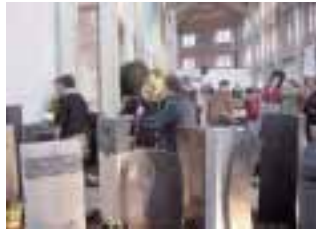
Kronacher Steinmetztreff 2008

Unter dem Motto »Granit und Trauer« veranstaltet die Granitwerk Kronach Gläsel & Weber GmbH ihren diesjährigen Kronacher Steinmetztreff am 14. und 15. November in der Kühnlenzpassage in Kronach. Begleitend zur neuen Grabmalausstellung werden die Veranstalter eine neue Software-Lösung für Online-Kalkulationen vorstellen. Die Dienstleistung wurde in Zusammenarbeit mit der Firma Wihofszky erarbeitet und soll Kunden den