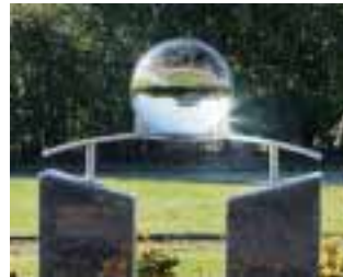
In der Glaskugel spiegelt sich die Welt auf dem Kopf.

den Strahlen erinnern an die Strahlenmonstranz eines Heiligen. Bei Sonnenschein bilden sie eine gut sichtbare Verbindung vom Grabmal zur Sonne. Bei Dämmerung und in hellen Nächten leuchten die Sterne und der Mond in der Kristallkugel.