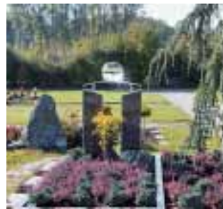
Effektvolle Kombination aus Glas, Edelstahl und Stein

In der Kugel spiegelt sich die Umgebung kopfüber wider. Alle Bewegungen im Umfeld des Grabmals sind deutlich erkennbar. Scheint die Sonne auf die Kugel, entsteht je nach Stärke der Einstrahlung am Eintrittspunkt ein lebendiger, sich ständig bewegender Strahlenkranz. Gegenüber treten die Strahlen stärker gebündelt mit größerer Intensität aus der Kugel aus und lassen einen zweiten, sehr dichten Strahlenkranz über dem Grab entstehen. Die in der Luft schwebenden, irisieren-