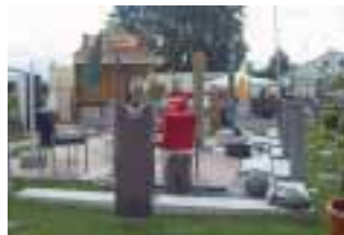
Der Innungsstand auf der Rheinischen Landesausstellung

treuung wechselten sich die Innungsmitglieder ab. Sie beantworteten Fragen und fertigten vor den Augen der Besucher eine Skulptur. Interessierte konnten sich selbst in der Steinbearbeitung versuchen.