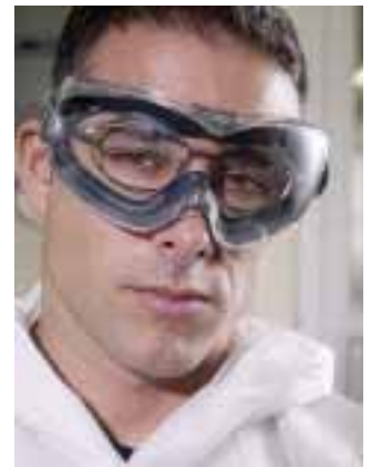
Vollsichtbrille DuraMaxx™ von Sperian

Sperian Protection Deutschland GmbH & Co KG Kronsforder Allee 16 23560 Lübeck Tel.: 0451/702740 Fax: 0451/798058 infogermany@sperianprotection.com www.sperianprotection.de