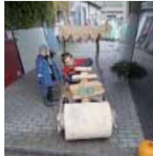
Fred Feuerstein lässt grüßen!