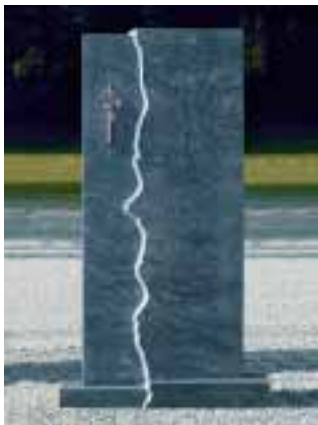
Grabstein aus Verde Brillante

HEL Natursteinhandel GmbH Elmar Hillebrand Gartenstraße 12 80809 München Tel.: 089/30767976 Fax: 089/31568661