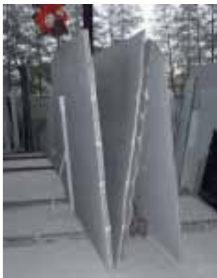
Sichere Lagerung durch die Haltestütze von Kochtokrax

Immer wieder passieren Unfälle durch umstürzende Natursteinplatten, die nicht sicher gelagert wurden. Um dem entgegen zu wirken, hat die Albert Kochtokrax GmbH aus Verl eine kostengünstige Haltestütze für Unmaßtafeln entwickelt, mit der Rohtafeln gefahrlos von einem Mitarbeiter vermessen sowie ein- und ausgelagert werden können. Die Stütze besteht aus einem 1,75 m langen Rechteckrohr, an das die Tafeln angelegt werden, sowie einer Druckstrebe zur Lastableitung und einem Stützfuß mit Querstrebe zum Ansetzen an den Plattenstapel. Stabquerschnitt und Schweißnähte der verzinkten Konstruktion sind statisch geprüft und können bei bestimmungsgemäßer Verwendung mit bis zu 2t Platten-gewicht belastet werden. Um Platten zu lagern, schiebt der Mitarbeiter die Lagerhilfsstütze mit dem Fuß unter die Rohtafel und zieht sie bis an die