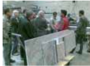
Natursteinschulung der MHC-Mitglieder bei Strasser

Die Tischlerbranche spürt die Auswirkungen der Wirtschaftskrise kaum. Vielleicht liegt es daran, dass diese Branche sehr flexibel ist und zukunftsorientiert denkt, um sich auf Veränderungen in der Unternehmenswelt einzustellen. Vor 20 Jahren war Holz der einzige Werkstoff für Küchenarbeitsplatten. Das hat sich verändert und so muss der Tischler heute über alternative Materialien wie Naturstein, Glas oder Aluminium Bescheid wissen, um seine Kunden kompetent beraten zu können. Aus diesem Grund organisierten