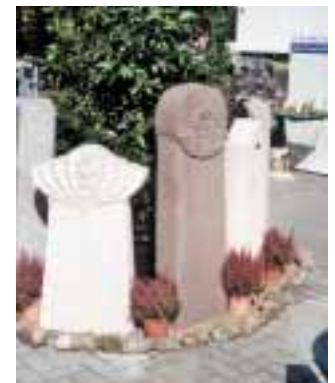
Grabmalrondel mit eigenen, von Kahnert handwerklich bearbeiteten Entwürfen

Grabmale Kahnert Steinmetzmeisterbetrieb Turnerstraße 195 28779 Bremen Tel.: 0421/606000