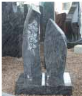
Alles Gute kommt von Böse - so auch dieses Grabmalmodell.

»Alles Gute kommt von Böse« - unter diesem Motto präsentiert die Max Böse Natursteinwerk GmbH in Großenlүder auf ihrer Hausmesse vom 28. November bis 1. Dezember Neuigkeiten und Trends, darunter getrommelte Felsen, aus einem Stück eingefasste Urnenanlagen und Liege-