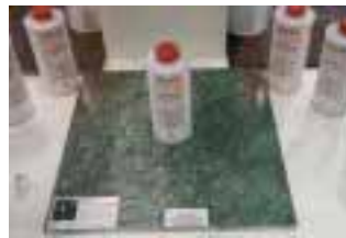
Intensivere Farbergebnisse durch AKEMI® Farbvertiefer Plus und AKEMI® Stone Ink

Neue und bewährte Produkte präsentierte der Bauchemiehersteller Akemi auf der Marmomacc. Neu ist u. a. AKEMI® Stone Ink, mit der die Spezialimprägnierung AKEMI® Farbtonvertiefer Plus für feingeschliffene und polierte, saugfähigen Natur- und Kunststeine eingefärbt werden kann. So lässt sich die Farbe der Steinoberfläche noch stärker intensivieren oder ändern. Laut Herstellerangaben ist das Produkt u. a. wasser- und schmutzabweisend und sowohl im Innen- als auch Außenbereich einsetzbar.