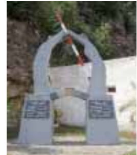
Symbol für das Miteinander im vereinten Europa: Die für die Landesausstellung gefertigte Skulptur »GRENZE«

Im Rahmen eines grenzüberschreitenden Projekts haben die Landesberufsschule Schrems und die Steinmetz-Landesinnung Niederösterreich gemeinsam mit der bautechnischen Schule im tschechischen Svetlá nad Sázava eine Skulptur geschaffen. Die auf der niederösterreichischen Landesausstellung 2009 gezeigte Arbeit mit dem Titel »GRENZE« besteht aus zwei Sockeln, die für die beiden Staaten Österreich und Tschechien stehen. Verbunden sind sie durch eine Brücke aus österreichischem und tschechischem Granit - Symbol für das Miteinander im vereinten Europa. Zwei Figuren beseitigen einen Grenzbalken mit Stacheldraht.