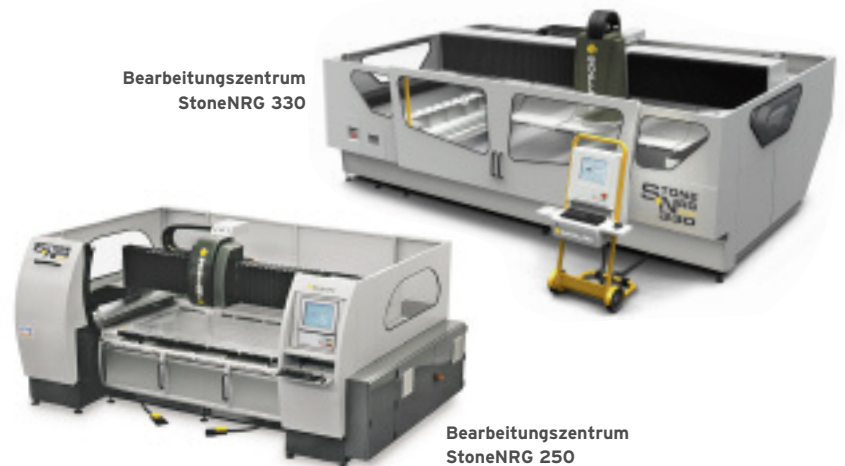
Bearbeitungszentrum StoneNRG 330

Die Bearbeitungszentren sind durch ein kompaktes und ergonomisches Design gekennzeichnet. Der Maschinentyp StoneNRG 250 benötigt bei einer Bearbeitungsfläche von 2500 mm x 1200 mm, einschließlich integriertem Schaltschrank, nur eine Stellfläche von ca. 12 m 2 . Die Maschine StoneNRG 330 ist für eine Bearbeitungsfläche von 3300 mm x 1700 mm ausgelegt und hat einen Platzbedarf von ca. 20 m 2 . Während die StoneNRG 250 nur für die Bearbeitung plattenförmiger Erzeugnisse bis 30 mm Dicke geeignet ist, ist die StoneNRG 330 modular aufgebaut und wird in sechs Varianten und drei Ausführungen angeboten. Zu den Varianten zählen drei oder vier gesteuerte Achsen, Werkstückdicken bis 300 und 600 mm, eine B-Achse mit \pm 3^\circ und eine C-Achse mit 0 ... 360°.