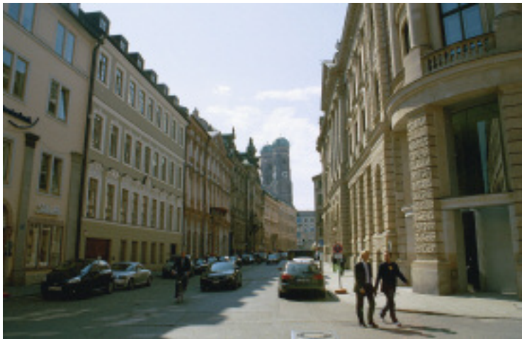
München: Lagert »fränkische Beutekunst« in den Museen der Landes- hauptstadt?