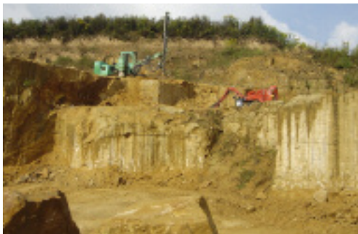
Die Firma Erich Seubert baut Sandsteine in eigenen Brüchen ab.

Erich Seubert GmbH Transporte - Natursteine Maisenbacher Straße 4 97271 Kleinrinderfeld Tel.: 09366/9073-40 Fax: 09366/9073-11 mail@erich-seubert.de www.erich-seubert.de