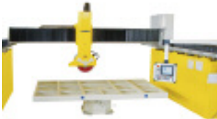
Die neue Donatoni-Brückensäge RD 825 für Blattdurchmesser bis zu 825 mm

Am 27. und 28. November veranstaltet die Weha Ludwig Werwein GmbH aus Königsbrunn wieder ihre alljährlichen Infotage. Präsentiert werden u. a. neue Maschinen, wie z. B. die neue Donatoni-Brückensäge RD 825 für Blattdurchmesser bis zu 825 mm, neue Werkzeuge und Fahrzeuge sowie aktuelles Zubehör. Besucher können wieder von zahlreichen Rabatt- und Messe-Aktionen profitieren.