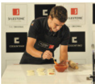
Fernando Alonso kocht auf Silestone®

Cosentino Center München Birkerfeld 48 83627 Warngau Tel.: 08024/90228-0 Fax: 08024/90228-29 munich@cosentinogroup.net www.cosentinogroup.net