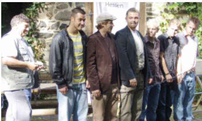
Die neuen Gesellen werden aus den Fesseln der Lehrzeit gelöst.

ihnen und dankte den Ausbildungsbetrieben sowie der Berufsschule und den Gesellenprüfungsausschuss für ihr Engagement. Rode sprach von den Höhen und Tiefen der Lehr-