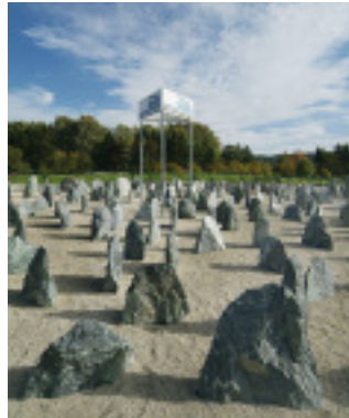
Das vielfältige Felsenangebot der Firma NKA

Vom 13. bis 15. November lädt die Firma Naturstein Kontor Allagen zur Herbstmesse ein. Besucher erwartet auch in diesem Jahr eine Felenausstellung mit mehr als 20 verschiedenen Materialien. Außerdem werden Ornamente und Oberflächenbearbeitungen sowie Einfassungen in verschiedenen Formen, Materialien und