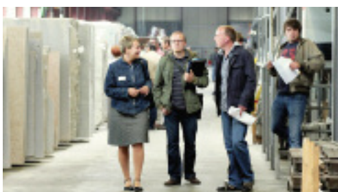
Gäste auf dem Sommerfest