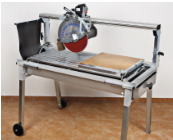
Die »Karl Dahm Super Cut«

Karl Dahm & Partner GmbH Ludwigstraße 5 83358 Seebruck Tel.: 08667/878-0 Fax: 08667/878-200 info@dahm-werkzeuge.de www.dahm-werkzeuge.de