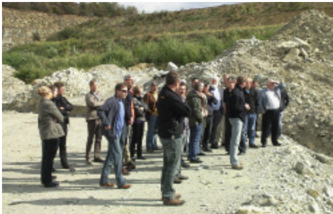
Bruchbesuch im Rahmen des Bauseminars in Anröchte