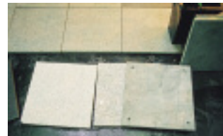
Das neue flexible Fliesenverlegesystem Cento

Badrul Hasnain. Bewegungen innerhalb des Systems seien unmöglich.