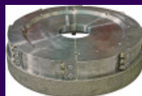
Kombi-Werkzeug zum Scharrieren und Kalibrieren

Oberflächenbearbeitungswerkzeuge und Maschinen