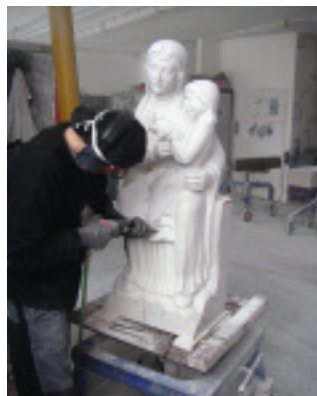
Kopie der Madonna von Wessobrunn