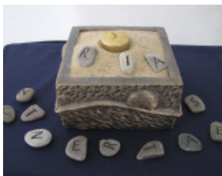
»Memories« von Carsten Schmidt