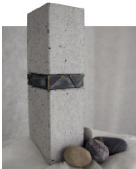
»Band« von Sebastian Damm