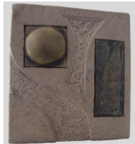
»Facetten des Lebens« von Andreas Arnold