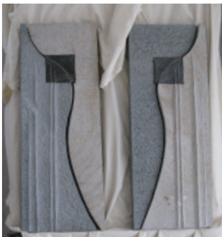
»Freundschaft« von Ulrike Glaubitz