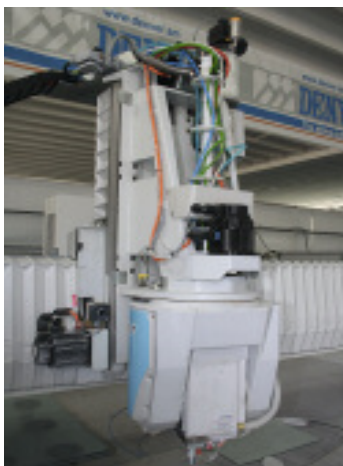
Das geöffnete Bearbeitungszentrum DIGIT Stone im Showroom

Glasbearbeitungsmaschinen haben bei Denver an der Maschinenproduktion einen Anteil von ca. 10 %. Der Unterschied zwischen Glas- und Natursteinbearbeitungszentren ist nicht so erheblich und spiegelt sich größtenteils in der Software wider. Im Jahr 2007 kam das 5-Achs-Bearbeitungszentrum DIGIT für die Glasbearbeitung auf den Markt. 2008 entwickelte Denver daraus die DIGIT Stone. Die Maschine ist durch sieben Schutzrechtsanmeldungen und bestätigte Patente geschützt, die auch von der Firma Saccardo, Hersteller der Elektroschneidspindeln, eingebracht wurden. Unter den geschützten Lösungen sind ein »selbst justierender Tisch«, eine neue Detailkonstruktion im Bereich der Spannzanze und das System XDrive, welches wiederum aus mehreren Teillösungen besteht. Bei dem selbst justierenden Tisch handelt es sich um eine Aluminium-Stahl-Konstruktion, die bei Temperaturänderung keine Verzugerscheinungen zeigt. Im XDrive-System wird das Wasser nicht wie bisher durch den gesamten Spindelkörper, sondern im Drehkopfbereich zugeführt. Das Leckwasser, das bei dieser Art »Spülkopf« austritt, wird durch Druckluft nach außen gefördert. Denver hat unserer Redaktion anhand von Zeichnungen und