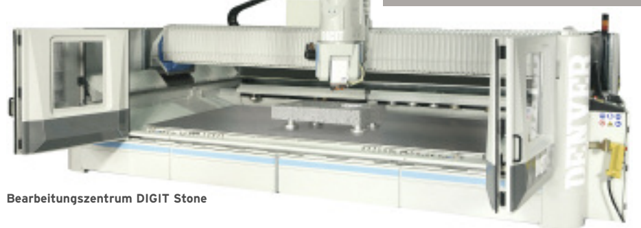
Bearbeitungszentrum DIGIT Stone