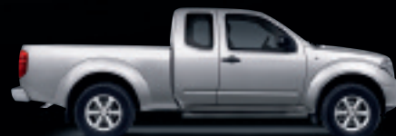
Abb. zeigen Sonderausstattung.