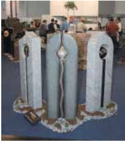
Steine der Serie »Memento Bewegung«