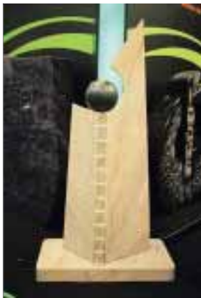
Kurz Natursteine: Modell aus Rainbow und Indish Black