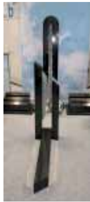
Grabmal mit »Glanzpunkten« und Modellreihe auf dem neuen Stand von Büttner