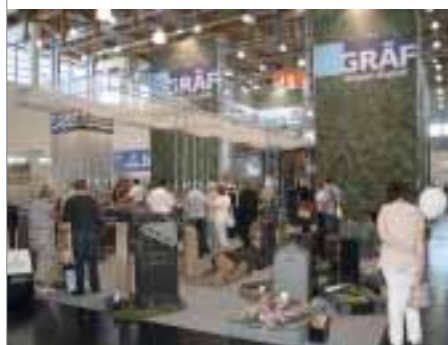
Stand der Firma Gräf Granit