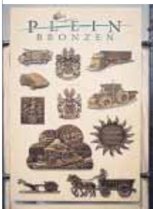
Für individu- elle Grabmale gefertigte Motive aus Bronze von Plein