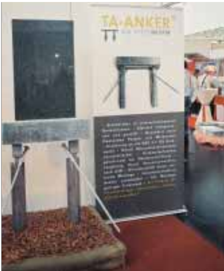
Der TA-Anker von SpittelMeister Stahlbau: Die standsichere Verankerung für Grabsteine orientiert sich an der TA-Grabmal.

kommt ohne Betonfundament aus, ist statisch überprüft und orientiert sich an den Anforderungen der Unfallverhütungsvorschrift VSG 4.7 (TA-Grabmal). Der TA-Anker wurde mit einer Prüflast von 500 kg getestet; erst hier begannen sich Teile der Unterkonstruktion im Erdreich zu verformen. Die Vorlage des statischen Prüfberichts des Ankers reicht für Friedhofsverwaltungen als Nachweis für die Standsicherheit. Auf die in der TA Grabmal geforderte Abnahmeprüfung kann also verzichtet werden. Damit hätten nun auch Bestatter und Friedhofsgärtner die Möglichkeit, Grabmale standsicher zu versetzen. Laut Nils Ohlen, Vertriebsleiter Nord der Pforzheimer Grabmale, habe man aber im Bestreben, mit Steinmetzen zu kooperieren, 140 Innungsmeister und den BIV-Vorstand schriftlich auf den Messestand eingeladen. Bis zum dritten Messetag waren nur