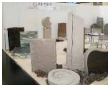
Gaedke: Vielfalt des Nordens

Überdies wirbt Just derzeit auf dem Grabmalsektor mit einer so genannten Greenline. Darunter versteht man ein Dutzend Materialien europäischer Herkunft, die nicht erst energieaufwändig und damit klimabelastend über einen Ozean geschippert kommen – von Aurora über Emerald Pearl und Ruschita bis Vanga. Just GmbH & Co Naturstein KG Tel.:034328/70440 www.just-naturstein.de