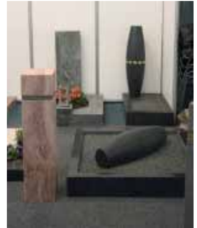
Neue Grabmalformen bei Thust