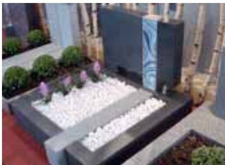
Glassicht-Urne im Grabmal auf dem Stand der Kusser Granitwerke

Kurz Natursteine GmbH Tel.: 06251/855900 www.kurz-natursteine.de