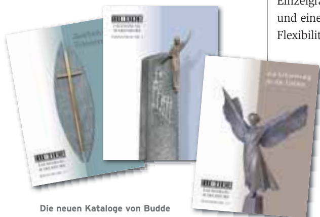
Die neuen Kataloge von Budde

Neu bei Budde sind die Kataloge K14, K13 und FK5. »Die abgebildeten Grabmale sind in puncto Design, Material und Fotoqualität vorbildlich«, so GF Wolfgang