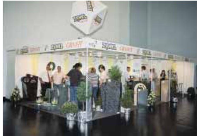
30 neue Grabmalmodelle präsentierte die Firma Zankl auf der Stone+tec.

industrie in den letzten Jahren geschaffen hat! Jeder hat Ideen umgesetzt, jeder hat seinen Stil.«