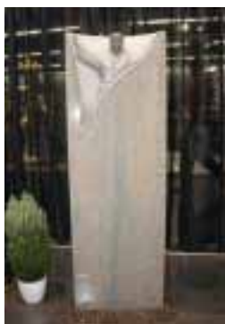
Lithos-Grabzeichen, gestaltet von Robert Simon

Mainzer Grabmaldesign Tel.: 02175/1386 www.mainzer-grabmale.de