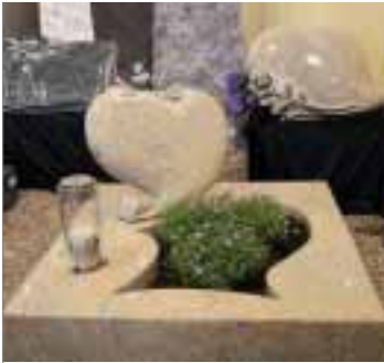
Urnengrab aus Sandal Gold