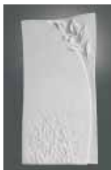
Grabmalmodell von Just