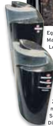
Zweiteiliges Grabstein- modell aus Indisch Schwarz (poliert) und Di Cambio (matt).