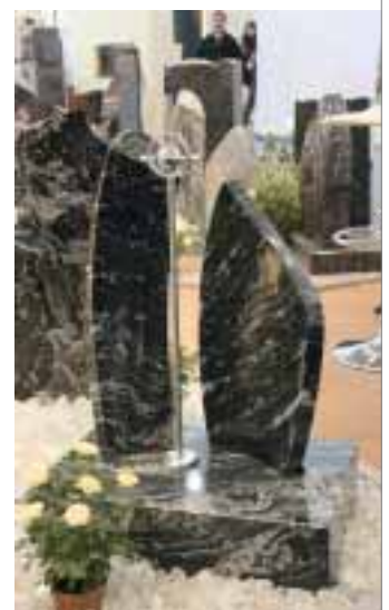
Grabmal mit Edelstahlkreuz aus King Black

Weniger Modelle und mehr Module präsentierten die Firmen Max Böse und Böse. Rosen und Kreuze aus Edelstahl gibt es in unterschiedlichen Größen zur Kombination mit Grabmalen, die ebenfalls in verschiedenen Größen und Mate-