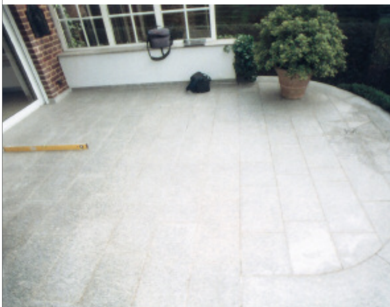
Der Terrassenbelag aus Bianco Galicia

Das Gericht beauftragte einen Sachverständigen, der in einem umfangreichen Gutachten u. a. feststellte, dass die Terrasse mit einer zu geringen Aufbauhöhe ausgeführt worden war. Durch ein Gefälle von lediglich 0,4 % konnte das Wasser nicht ausreichend abfließen. Außerdem wurde die Feuchtigkeit durch die Verlegung im dichten Mörtelbett im Verbund gehalten. Bereits bei der Verlegung der Terrasse im Jahr 1997 wäre ein Gefälle von 1 bis 2 % erforderlich und auch möglich gewesen, so der Sachverständige.