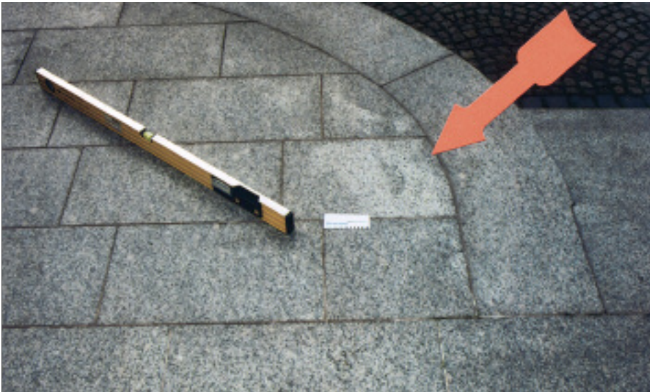
Feuchtigkeitsflecken und trockene Stellen im Randbereich