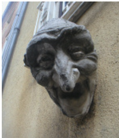
Wasserspeier im Mittelalter wurden häufig als Dämonen oder Fabelwesen gestaltet.

Vielleicht gehört Ihr Unternehmen zu ausführenden Betrieben und Sie haben sich auf Natursteinfassaden spezialisiert. Zeigen Sie, warum Sie sich für welche Befestigungstechniken entscheiden und welcher Erfahrungsschatz hinter dieser Beurteilung steht. Bauen Sie durch Ihr Expertenwissen das Vertrauen auf, das ein solcher Auftrag erfordert. Und dokumentieren Sie Arbeitsschritte in Bildern – das sagt häufig mehr als viele Worte. Das gleiche gilt für den Innenausbau. Sind Sie planungsstark oder arbeiten Sie