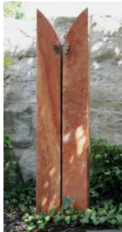
Die strenge Formgebung des Brunnens unterstreicht den Charakter des Steins.

Gerade im Innenausbau ist es auch von Vorteil, genau zu dokumentieren, wie Sie arbeiten – termintreu, mit wenig Dreck inklusive Endreinigung, mit möglichst wenig Unbill für die Bewohner und mit vertrauenswürdigen Mitarbeitern, die tunlichst der deutschen Sprache mächtig sein sollten. Saubere Autos, sauberes Werkzeug und eine einheitliche saubere Arbeitskleidung runden das Bild ab.