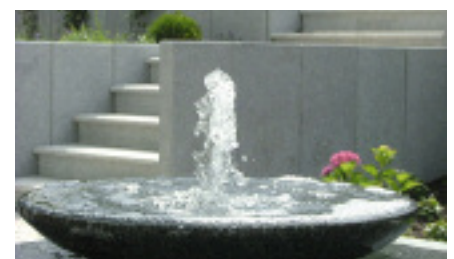
Dunkelgrauer Fürstensteiner Granit verleiht der großen Wasserschale ihren besonderen Reiz.

chen (Felsen), setzen Sie als Händler auf Vielfalt oder haben Sie sich auf Figürliches oder spezielle Schriften spezialisiert? Folgerichtig sollten Sie Ihren Marktauftritt nicht auf den Sammelbegriff ‚Grabmale‘ ausrichten, sondern auf Ihren ganz persönlichen Schwerpunkt, der Ihrem Betrieb die unverwechselbare Charakteristik verleiht. Erstens wissen dann die Kunden in Ihrem Netzwerk genau, was sie bei Ihnen erwarten dürfen und werden Sie gezielt auswählen. Zweitens, und das ist ein weiterer wesentlicher Aspekt, können Sie sich durch die Beschreibung Ihrer besonderen Fähigkeiten neue Geschäftsfelder erschließen – beispielsweise im Galabau die Gestaltung von Brunnen, Brücken oder Treppenanlagen. Für Restaurierungsspezialisten gilt das Gleiche: Wo liegen hier Ihre Schwer-