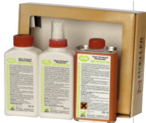
Das neue Quarz-Komposit-Schutz-, Reinigungs- und Pflegeset