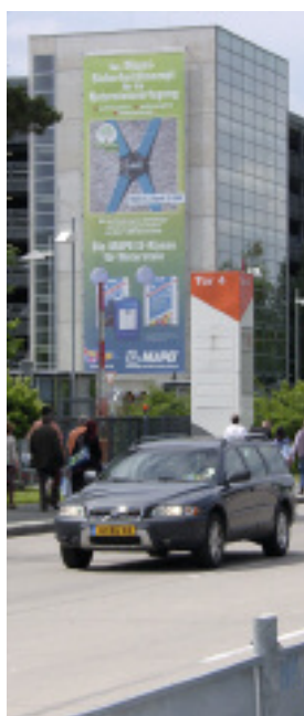
Das »Mapei-Sicherheitskonzept für die Natursteinverlegung« fiel schon am Messeparkhaus ins Auge.

Lithofin hatte im Vorfeld der Messe noch nichts verraten. Für entsprechendes Aufsehen sorgte (neben den Shoe Shine Boys) das lösemittelfreie neue Produkt Lithofin MN Fleckstop »ECO«. Es ist, auch auf großen Flächen, leicht zu verarbeiten (aufsprühen) und bewirkt keinerlei Farbtonvertiefung. Die lösemittelfreie Spezialimprägnierung wurde speziell für die aktuell im Trend liegenden Carbonatgesteine entwickelt und überzeugt durch einen exzellenten fett- und ölabweisenden Effekt, ohne das Aussehen des Steins zu beeinflussen. Getreu dem Motto »ökologisch nachhaltig und ökonomisch sinnvoll« verbindet Lithofin MN Fleckstop »ECO«