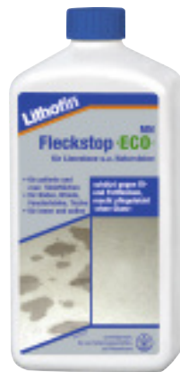
Lithofin MN Fleckstop »ECO«

die Umweltfreundlichkeit wässriger Produkte mit der wirtschaftlichen Notwendigkeit einer schnellen und einfachen Verarbeitung.