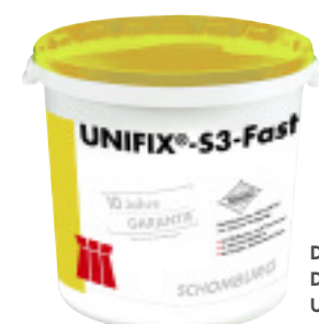
Der schnellhärtende Dünnbettmörtel UNIFIX®-S3-Fast

Schomburg GmbH Tel.: 05231/95300 www.schomburg.de