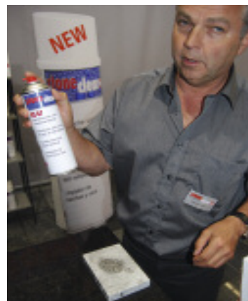
Roman Fuchs von stone clear bringt Flecken auf Stein schnell zum Verschwinden.

Die Firma Weiss Steinpflegeprodukte präsentierte ihre Datenbank mit 10 000 Steinamen und Infos zu Reinigung, Schutz und Pflege unter Berücksichtigung von Oberflächenbearbeitung, Einsatzbereichen und Rutsicherheitsanforderungen (Volltextsuche). Laut GF Winfried Weiß sind 500 000 individuelle Pflegeempfehlungen enthalten.