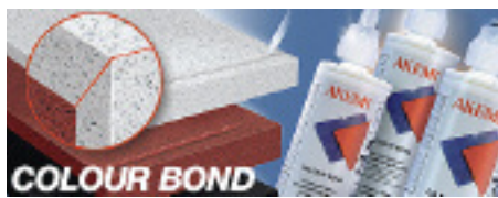
AKEMI® COLOUR BOND für unsichtbare Klebefugen

wirksames Reinigungs- und Desinfektionskonzentrat für Böden und Wände. Er zeichnet sich durch eine gute Reinigungswirkung sowie eine schnelle Entfaltung der Wirksamkeit bei niedriger Einsatzkonzentration aus.