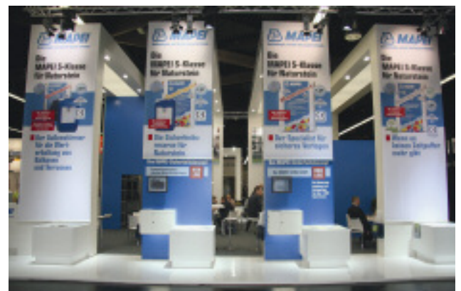
Sehr informativ: der neue Messestand von Mapei