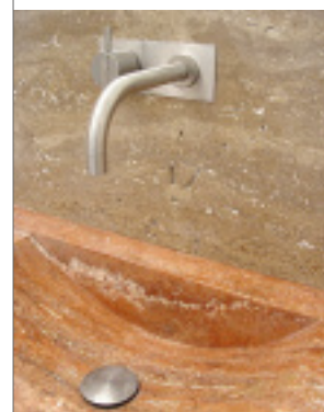
Travertin Persiano/ Travertin Noce geschliffen

Bei Naturstein ja! Denn hier bin ich im Format völlig frei – Fliesen sind immer irgendwie vorkonfektioniert. Das ist ja