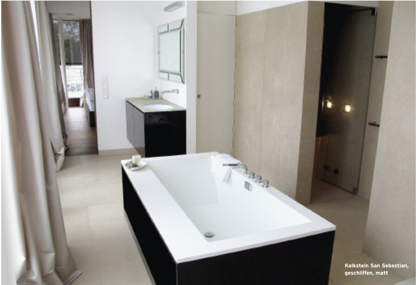
Kalkstein San Sebastian, geschliffen, matt