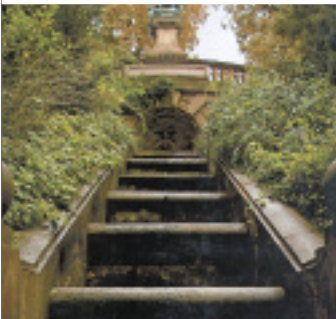
Constantin Baki erhielt eine Belobigung für die Restaurierung des Galateabrunnens in Stuttgart.