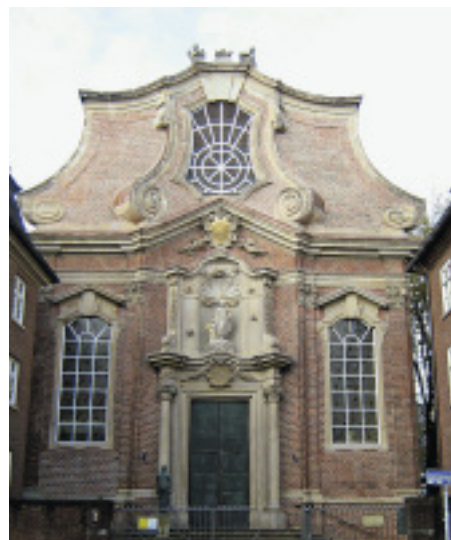
Eine Belobigung erhielt auch Werner Paetzke junior für die Fassadensanierung an der barocken Kirche St. Joseph in Hamburg.

Den zweiten Platz (4 000 €) belegt Eduard Schnell aus Fridingen mit denkmalgerechten Instandsetzungsarbeiten an der Evangelischen Stadtkirche in Sigmaringen. Die bei der letzten Instandsetzung durch Kunststeinrohlinge ersetzten acht Turmeckfialen sowie die komplett entfernten Giebelfialen und bekronende Kreuzblume wurden mit großem Feingefühl wiederhergestellt. Für die aus dem Rohblock gearbeiteten Rekonstruktionen nach den Entwurfsideen Stühlers (gemäß Fotos des Vorzustands) kam roter Sandstein in gotischer Formsprache zur Ausführung. Die begleitenden Bauteile wurden