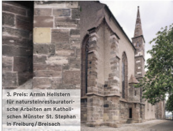
3. Preis: Armin Hellstern für natursteinrestauratorische Arbeiten am Katholischen Münster St. Stephan in Freiburg/Breisach