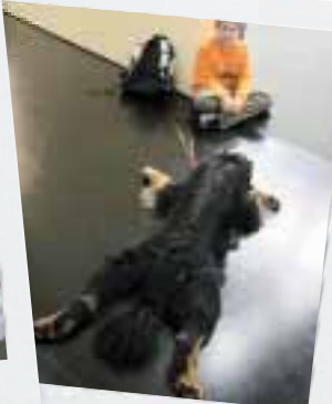
Ganz schön platt: Vier Tage Messe machen hundemüde.