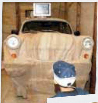
(N)ostalgie: Naturstein-Trabi auf der Stone+tec