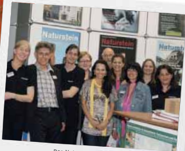
Das Naturstein-Team am Hauptstand in Halle 1