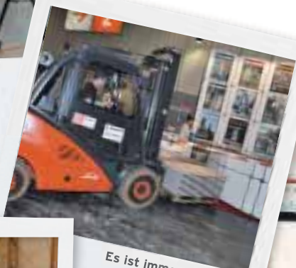
Es ist immer wieder ein Wunder, dass bis zur Messe alles fertig wird: Unser Hauptstand am Tag vor der Eröffnung