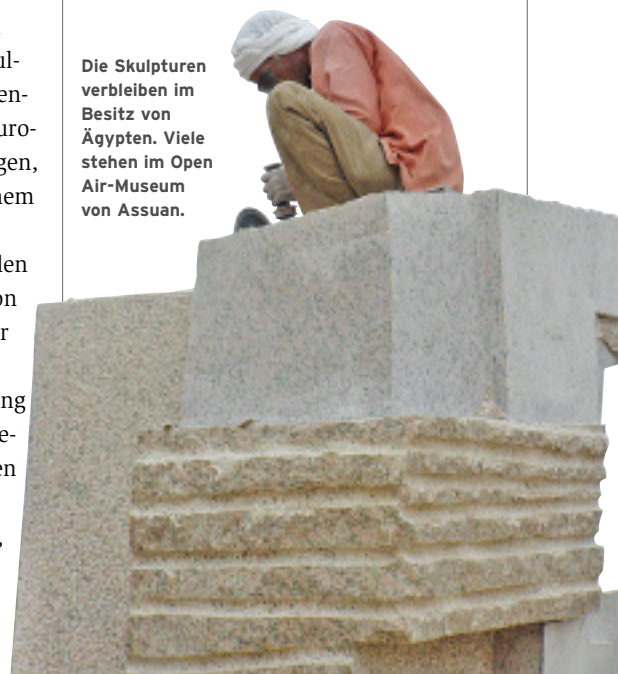
Die Skulpturen verbleiben im Besitz von Ägypten. Viele stehen im Open Air-Museum von Assuan.