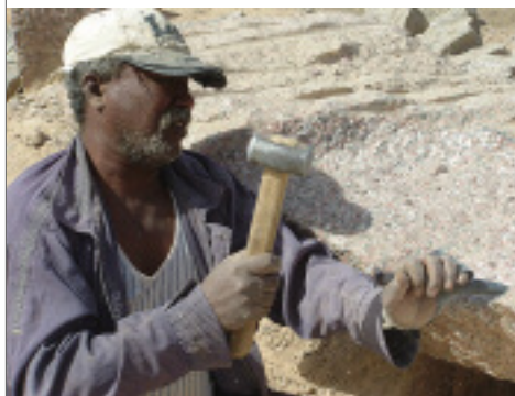
Oben: Unvollendet blieb dieser 40 m lange und 2 000 t schwere Obelisk.