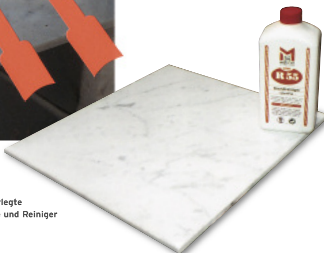
Unverlegte Fliese und Reiniger

Juni 2007 in Höhe von ca. 5 000 €. Der Steinmetz rechnete den Aufwand für das Kristallisieren und die Gutachterkosten dagegen. Die Klage landete vor dem Amtsgericht. Der Sachverständige wurde dazu aufgefordert, vor Gericht Fragen des vom Großhändler engagierten Rechtsanwalts zu beantworten. Dieser Forderung kam er in aller Ausführlichkeit nach.