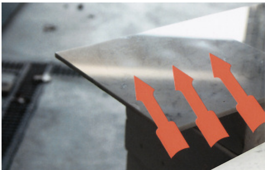
Gereinigte Fliese mit Abschattungen