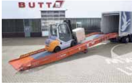
Die mobile Verladerampe BK 912