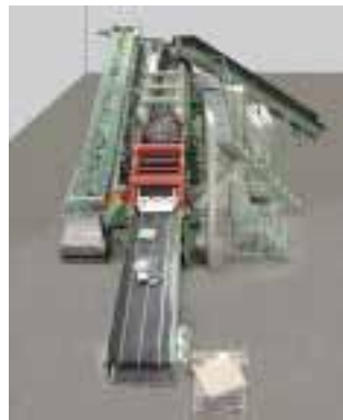
Durchlaufanlage für die Steinbearbeitung von Rösler

zur Gleitschliffanlage. Die Automatisierung minimiert manuelle Arbeitsschritte, verbessert die Arbeitssicherheit und erhöht Durchlauf und Wirtschaftlichkeit. Gleitschliffanlagen lassen sich auch in Fertigungslinien integrieren.