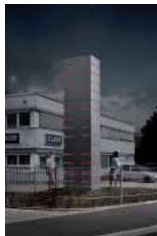
Visualisierung der OSZ-Skulptur bei Nacht