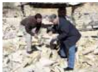
Fossilien-sammler im neuen Hobby-Steinbruch

In Solnhofen wurde vor kurzem ein neuer Steinbruch für Hobby-Geologen und Sammler eröffnet. Er befindet sich auf dem Steinbruchgelände der Firma »Solenhofer-Aktienverein« und steht Touristen und Fossilien-sammlern gegen eine geringe Gebühr zur Verfügung. Betreiber ist die Gemeinde Solnhofen. Die Resonanz ist groß, nicht zuletzt, da in dem Steinbruchareal bereits zwei Urvögel (Archaeopteryx) gefunden wurden. Weitere