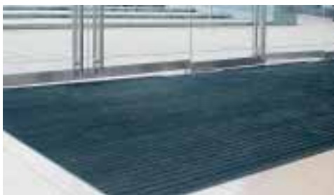
Eingangsmatte Diplomat 517 GS

Emco Bau- und Klimatechnik GmbH & Co. KG Breslauer Str. 34-38 Postfach 18 60 49803 Lingen (Ems) Tel.: 0591/9140-0 Fax: 0591/9140-852 bau@emco.de www.emco.de