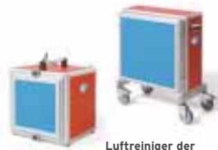
Luftreiniger der Pullmann-Ermator-Serie

Gegen Staubbelastung auf der Baustelle hat Seelbach international aus Rennerod die Luftreiniger Pullmann-Ermator-Serie im Programm. Eine neue DVD von »Dr. Staubfrei« zeigt, wie die Luftreiniger funktionieren und eingesetzt werden. Die Demonstration mit dem Titel »Umbau ohne Staubwolken« ist mit allen gängigen PC-Programmen abspielbar. Pullmann-Ermator-Luftreiniger werden entweder in einer Türöffnung aufgestellt, um Staubverteilung außerhalb des Arbeitsraumes zu vermeiden, oder auch direkt im betroffenen Raum eingesetzt. Dort produziert der Luftreiniger einen Luftkreislauf, indem die verschmutzte Luft angesaugt und die gereinigte wieder ausgeblasen wird. Befindet sich der Reiniger in der Türöffnung, wird ein Unterdruck im Arbeitsraum erzeugt, der dazu führt, dass frische Luft von außen eindringt. Dabei muss die Tür bis auf einen schmalen oberen Spalt mit Folie verhängen sein, damit die erforderliche Zirkulation entsteht. Die Luftreiniger von Seelbach gibt es in verschiedenen Ausführungen. Die Filter sind aufgrund der großen Oberflächen nach Angaben des Herstellers sehr