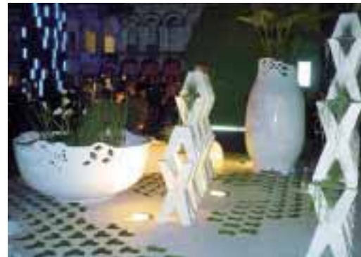
Designobjekte aus Laaser Marmor auf der Mailänder Möbelmesse

Ein weiteres Natursteinhighlight im Rahmen der Möbelmesse war INTERNI DESIGN ENERGIES, eine Initiative der Zeitschrift INTERNI und des Verlags Arnoldo Mondadori Editore mit Unterstützung der Messe Marmomacc. Unter den Ausstellern war das Veroneser Natursteinunternehmen Testi Fratelli mit einer Vase und einer Schale aus Laaser Marmor (Design: Patricia Urquiola für den Innenhof der Universität von Mailand).