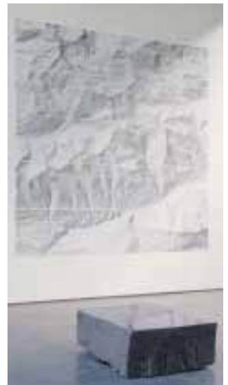
Terrainbild Steinlandschaft und Steinskulptur MARUL , 2007

Der freie Künstler und Bildhauer Jochen Kitzbihler zeigt noch bis zum 21. Juni in Freiburg/Herdern eine Werkschau. In den letzten Jahren hat sich Kitzbihler mit geologischen Erscheinungen und Landschaftsreliefs beschäftigt. Er entwickelte u.a. Terrainbilder, basierend auf Laserscannings der Erdoberfläche aus der Luft. Die hoch aufgelösten, plastischen Landschaftsreliefs zeigen Strukturen der Voralpen und sind als FineArt Prints auf Büttenpapier erhältlich.