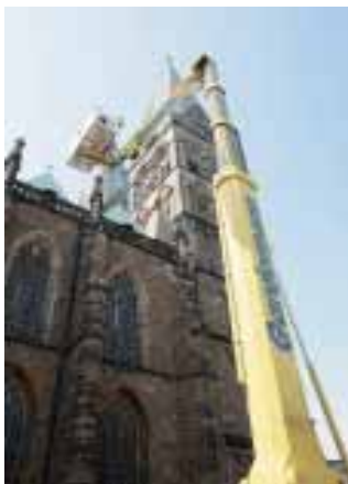
In wenigen Minuten ist die Arbeitsbühne auf 60 m ausgefahren.

Gardemann Arbeitsbühnen GmbH Weseler Straße 3a 46519 Alpen Tel.: 02802/9490 Fax: 02802/949349 info@gardemann.de www.gardemann.de