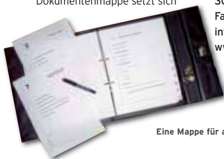
Eine Mappe für alle Fälle

Vertrieb Notfall- und Nachlaß-Mappe Postfach 710367 30543 Hannover Fax: 0511/27060174 info@notfall-nachlass-mappe.de www.notfall-nachlass-mappe.de