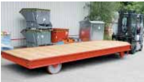
Das Stapler-Tender-System von Bauer

Bauer GmbH Eichendorffstraße 62 46354 Südlohn Tel.: 02862/709-0 Fax: 02862/709-155/-156 info@bauer-suedlohn.de www.bauer-suedlohn.de