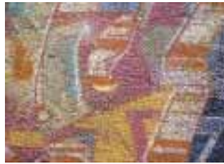
Graffiti: Kunst oder Ärgernis?

Ziel der Anti-Graffiti-Erfindung ist es, historische Bauwerke des Weltkulturerbes zu schützen. Denn Graffiti ziehen nicht nur ihre Ästhetik in Mitleidenschaft, sondern führen bei der Entfernung der bis in die Poren vordringenden Farben oft zu Beschädigungen der Bausubstanz. Das Anti-Graffiti bildet hingegen eine mit bloßem Auge nicht sichtbare, wasserabweisende Schutzschicht über der Mauer. »Das Produkt hält flüssiges Wasser ab, lässt jedoch Wasserdampf passieren und erlaubt der