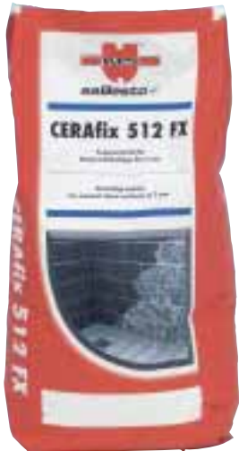
Der Fugenmörtel Cerafix 512 FX für Naturstein

und Zahlensystem unterstützt den Anwender bei der Auswahl der Produkte. Das Klebersortiment einen Flexklebemörtel zum Verlegen von Naturstein. Zum Verfügen von empfindlichen Natursteinbelägen bis 7 mm Breite hat Würth einen verfärbungsfreien Fugenmörtel im Sortiment. Für das Silikonieren wird ein Natursteindichtstoff für Anwendungen im Innen- und Außenbereich angeboten.