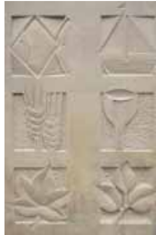
Entwurf aus der Vorbereitungsphase zur Meisterprüfung in Düsseldorf

In der Situationsaufgabe stellt der Meisterprüfungsausschuss den Prüfling vor eine reale berufliche Anforderung, die in höchstens acht Stunden bewältigt werden soll. Die Meisterprüfungsordnung verlangt fünf Situationsaufgaben, von denen eine durch den Prüfungsausschuss