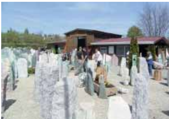
Spaltfelsen bei Natursteine Donderer

Natursteine Donderer Industriegebiet Mitte 88605 Messkirch Tel.: 07575/92444-0 Fax: 07575/92444-14 info@natursteinedonderer.de www.natursteinedonderer.de