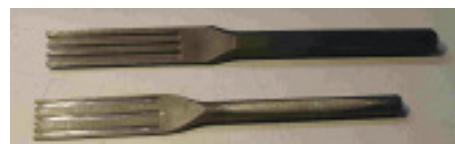
Fugenmeißel von Tomas Cechura, Firma Jointex