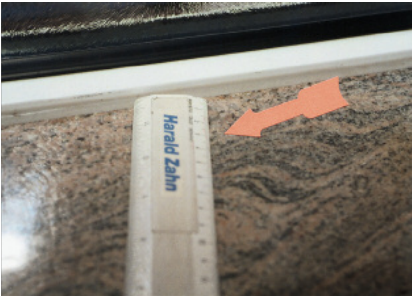
Kaum sichtbarer Stich am Plattenende