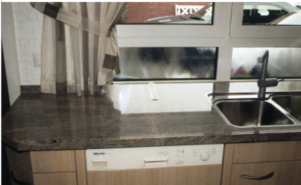
Ansicht der Küchenarbeitsplatte: Fotolineal im Bereich des Fensters

Das Gutachten hielt fest, dass Stiche in der Oberfläche von Küchenarbeitsplatten aus Naturstein nicht ausgeschlossen werden könnten, da es sich um ein Naturprodukt handele. Überdies könnten die Stiche mit einem Aufwand von