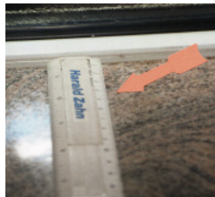
Auch dieser Stich ist kaum sichtbar.

300 € nachgearbeitet werden. Hinsichtlich der Griffe und Armatur stellte der Sachverständige fest, dass diese chrommatt seien und den geforderten und bestellten Erscheinungsformen entsprächen. Wegen der Dunstabzugshaube habe der Kunde gemäß den Bestellunterlagen 60 cm Breite bestellt.