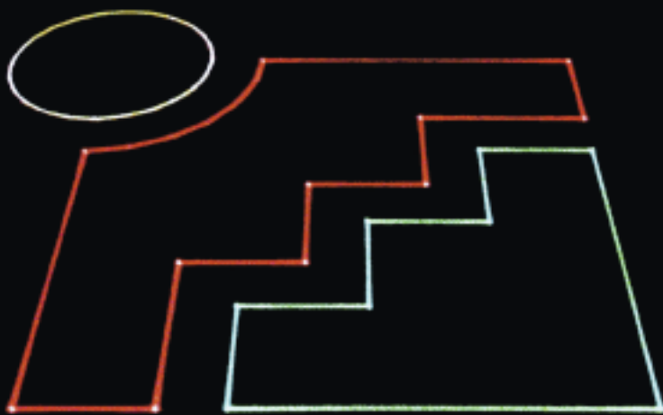
Komplexe Linienzüge mit hoher Präzision

Bei der Bearbeitung von Steinplatten vereinfachen Laserprojektoren viele Arbeitsabläufe. Sie reduzieren den Zeitbedarf und ermöglichen eine effiziente Nutzung von Material und Maschinenzeiten. So senken sie Kosten bei gleichzeitig erhöhter Genauigkeit und Qualität.