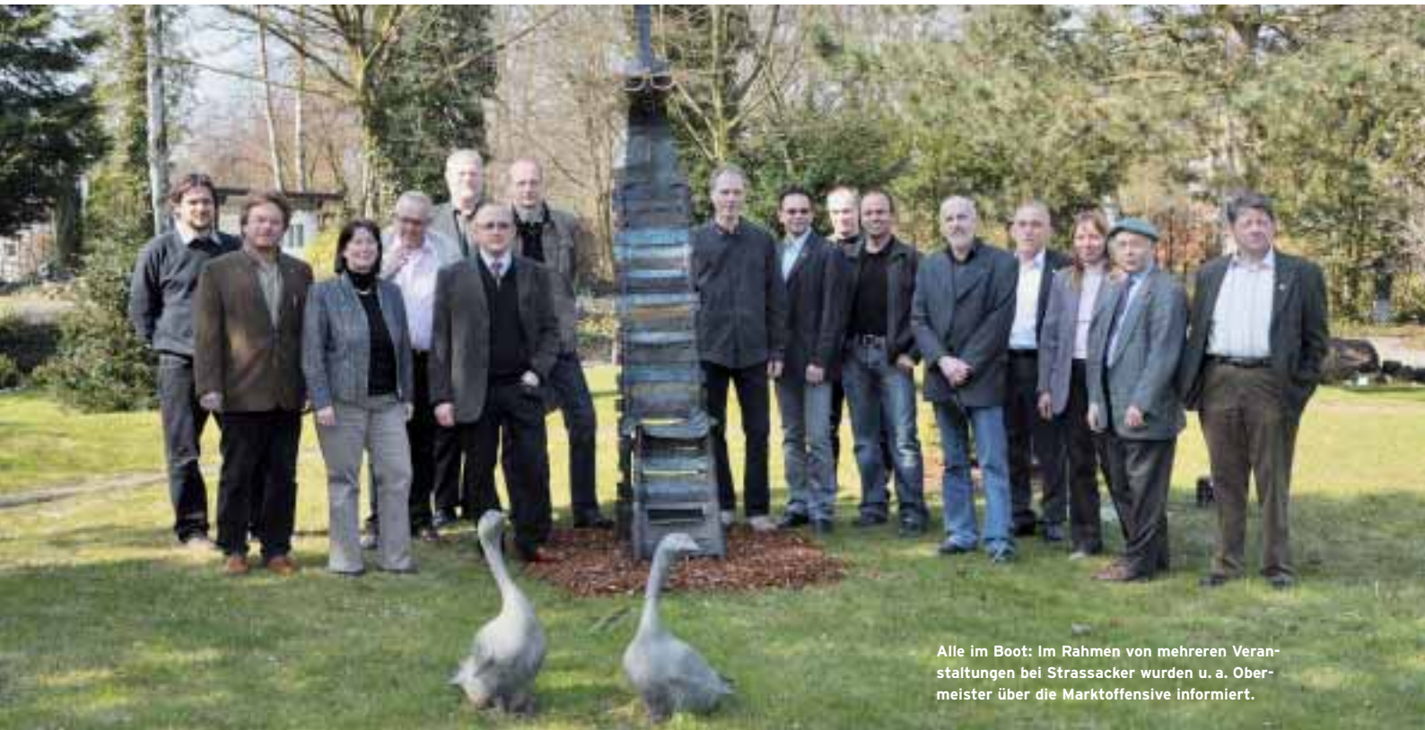
Alle im Boot: Im Rahmen von mehreren Veranstaltungen bei Strassacker wurden u. a. Obermeister über die Marktoffensive informiert.