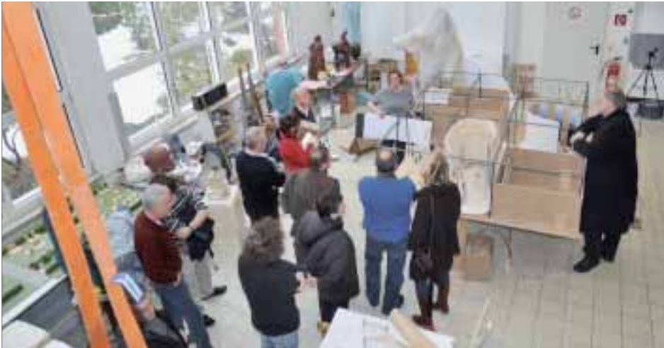
Gestalter diskutieren über die Umsetzung des Sonderschauprojekts