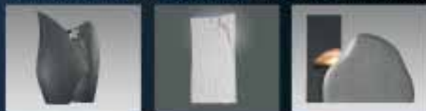
Die Modelle sind großmachmasstabvergrößert.

Zukunft Grabmal - Stone+Tec 2009 - Wir sind dabei! (Erfahren Sie mehr zu unseren exklusiven Aktivitäten im Internet)