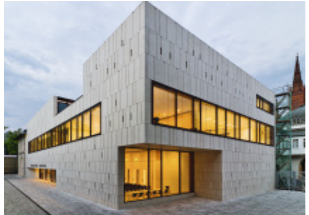
Besondere Anerkennung: Plenarsaal in Hessen

nach Plänen der Kölner Architekten saniert und um einen Neubau mit einer Fassade aus Würzburger Muschelkalk erweitert. Vertikale Öffnungen sind mit Backsteinen in der Farbe des Altbaus ausgefacht. Darin eingelassene Lüftungsklappen ermöglichen eine natürliche und kontrollierte Lüftung. Dadurch kann auf eine Vollklimatisierung der Räume verzichtet werden. Ausführende Firma war die GP Schuppertbau GmbH aus Halle. Die Jury überzeugte u. a. das Spiel mit Natur- und Backstein sowie die Umsetzung im massiven, konstruktiven Wandaufbau. Der Neubau des Stadtarchivs stelle eine architektonisch überzeugende und in seiner Materialität eigenständige Lösung für die Ergänzung eines historischen Gebäudes dar.