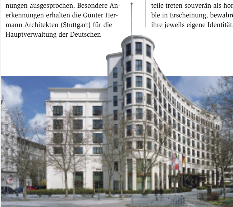
Besondere Anerkennung: The Charles Hotel in München

Beim Umbau und der Erweiterung der Deutschen Bundesbank in Berlin kamen verschiedene Natursteine zum Einsatz. U. a. wurden der Jura Travertin und Mooser Muschelkalk der Lochfassade des denkmalgeschützten Altbaus von 1953 saniert und ergänzt. Die Fassaden im Neubaubereich bestehen aus Creme Royal und Nero Assoluto, für die Bodenbeläge verwendete man Nero Assoluto, Grey Mist und Mooser Muschelkalk. Ausführende Firma war die Hofmann GmbH & Co. KG aus Werbach-Gamburg. Die Arbeiten im Bestand übernahm die Marmor-Line GmbH aus Wetzlar-Dudenhofen. Die einzelnen Bauteile treten souverän als homogenes Ensemble in Erscheinung, bewahren aber trotzdem ihre jeweils eigene Identität, so die Jury.