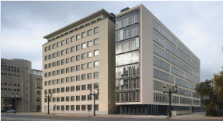
Deutsche Bundesbank in Berlin