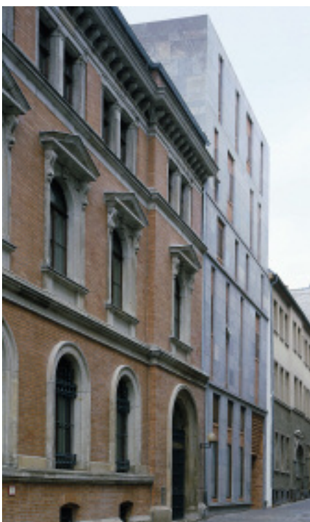
Alt und neu: Das Stadtarchiv in Halle mit seinem turmartigen Erweiterungsbau erhält eben- falls den Deutschen Naturstein- Preis

Auf der Stone + tec wird der Deutsche Naturstein-Preis verliehen. In diesem Jahr gibt es zwei Gewinner.