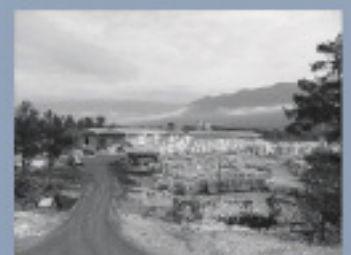
Limestone factory Demre