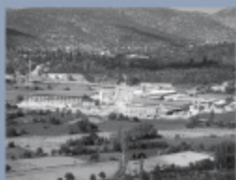
Main factory Isparta