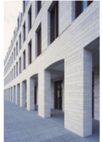
Erhält den Deutschen Naturstein-Preis: Das neue L-Bank-Gebäude auf dem Karlsruher Schlossplatz