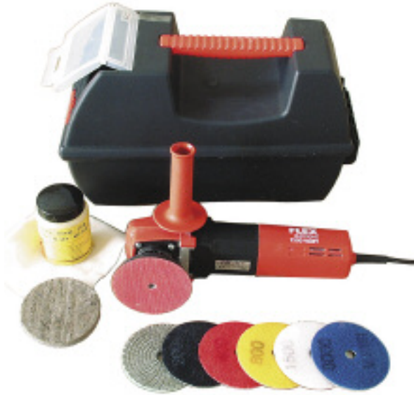
Quick-Set für trockene Schleif- und Polieraufgaben