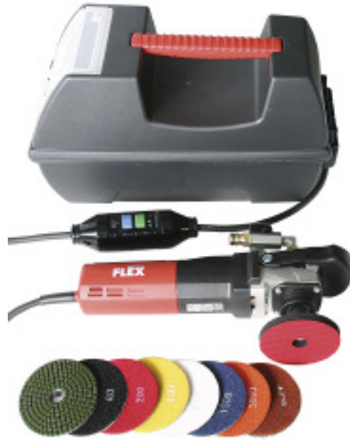
Quick-Set für den Nassschliff und die Nasspolitur

Quick-Set ist ein spezieller Koffer, der alles zum Ausführen kleiner Schleif- und Polierarbeiten enthält. Er ist in den Varianten »Trocken« und »Nass« erhältlich und besonders für Reparaturen und Nachbesserungen auf der Baustelle und zur Behebung vom Kunden verursachter Schäden geeignet. Durch gute Körnungsabstufung der Schleif- und Polierscheiben können alle Naturstein- und Engineered Stone-Erzeugnisse bearbeitet werden. Schwierige Materialien, die bei der Trockenbearbeitung unter anderem zu Brandflecken und Schlierenbildung neigen, sollten nass bearbeitet werden. Die Schleifscheiben werden durch Klettverschluss mit dem Aufnahmeteller verbunden. Quick-Set wird auch ohne Winkelpolierer geliefert.