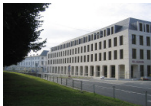
Schlossplatz in Karlsruhe: Bankgebäude des Büros WEINMILLER ARCHITEKTEN

struktiven Wandaufbau. Auch in diesem Jahr wurden nicht nur die Sieger ermittelt, sondern auch zahlreiche Besondere Anerkennungen und Lobende Erwähnungen ausgesprochen. Die Preisverleihung findet am 22. Mai in der EventArea auf der Stone+tec statt. Einen ausführlichen Bericht über den Deutschen Naturstein-Preis und den Peter Parler-Preis 2009 finden Sie in unserer Mai-Ausgabe.