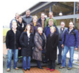
Mitglieder des Steinmetz-Erfa-Kreises auf dem Gelände der Firma Naturstein Recker in Wallenhorst.

Zum neunten Mal traf sich der Steinmetz-Erfa-Kreis. Der Kreis setzt sich aus sieben Betrieben aus Niedersachsen und Nordrhein-Westfalen zusammen, die sich zweimal jährlich zum Erfahrungsaustausch (Erfa) treffen. Dabei kommt der Kreis abwechselnd in den Betrieben der einzelnen Teilnehmer zusammen. Der zweitägige Austausch beginnt mit einem theoretischen Teil mit betriebswirtschaftlichen Themen. Am zweiten Tag wird der jeweilige Betrieb besichtigt und analysiert. Das erste diesjährige Treffen mit insgesamt zwölf Steinmetzen und deren Frauen fand in Wallenhorst in den Räumen der