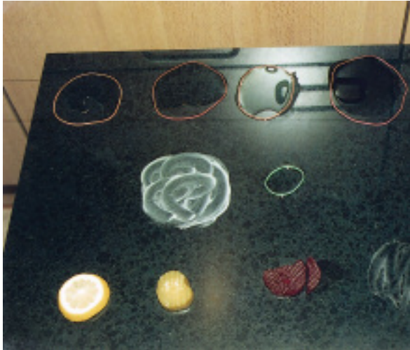
Beaufschlagung von Haushalts-Produkten