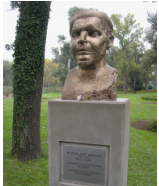
Fehl am Platz? Che Guevara- Büste im Wiener Donau- park

wieder rentabel machen und sich u. a. um die Vermarktung der italienischen Kunstschatze kümmern. »Porca miseria!«, jaulen die Kritiker und fürchten den Untergang der jahrtausendealten italienischen Kultur. Ganz so schlimm wird es vielleicht nicht, aber man darf auf neue Ansätze und Konzepte gespannt sein. Wer weiß, vielleicht gibt es in Italien bald die ersten Museen mit Drive-In oder die Eintritts-