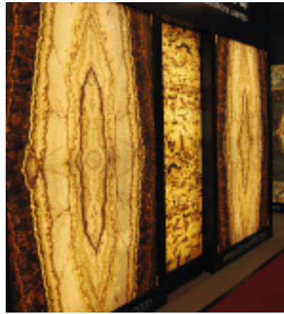
Das Kleinteilige, Lebhaftes und Verspielte kommt heute bei Natursteinanwendungen wieder vermehrt zum Zug.