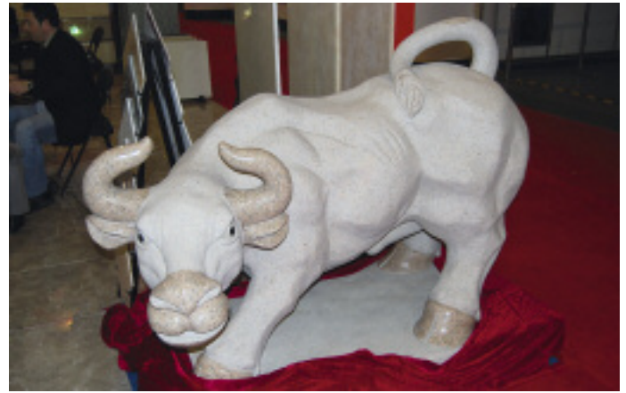
2009 ist in China das Jahr des Ochs. Kein Wunder, dass dieses Tier auf der Xiamen Stone Fair 2009 auch in Stein anzutreffen war.

ter aus andern Weltregionen auf den Plan. So wie in Shanghai sind auch auf der Messe in Xiamen wiederum mehrere Länder mit Gemeinschaftsständen vertreten. Den weitaus größten stellen die Türken, aber auch Italien, Spanien, Brasilien, Indien, der Iran, Frankreich und Finnland machten auf Spezialitäten aus ihren Län-