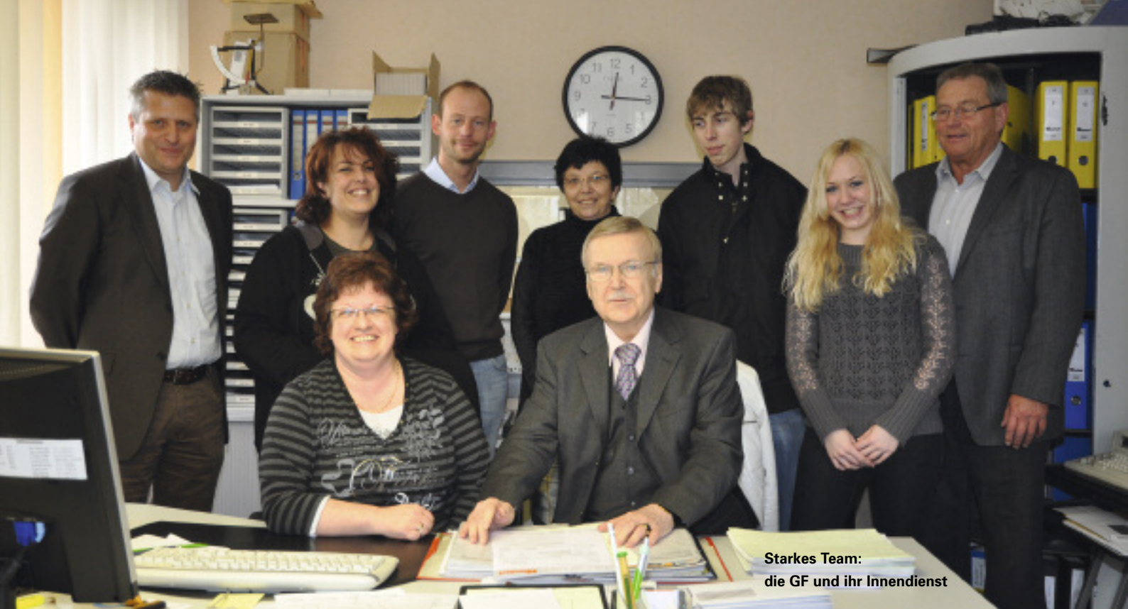
Starkes Team: die GF und ihr Innendienst