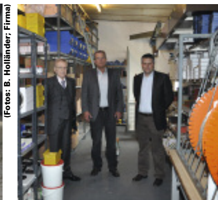
Blick ins Lager