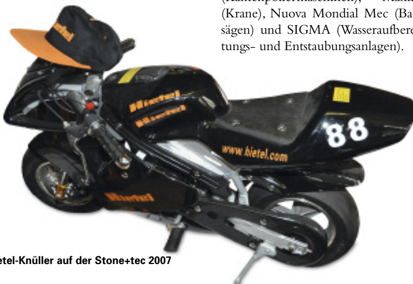
Hietel-Knüller auf der Stone+tec 2007