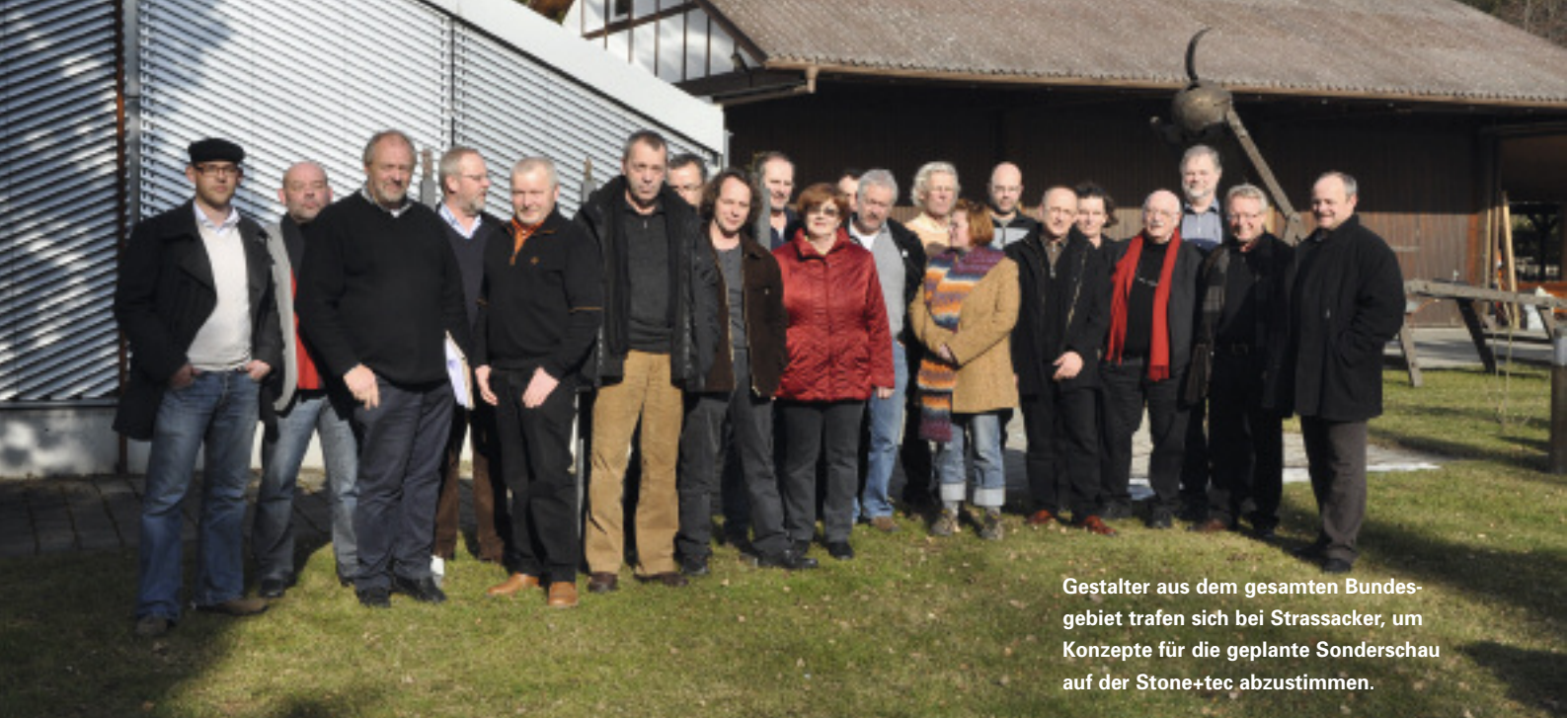
Gestalter aus dem gesamten Bundesgebiet trafen sich bei Strassacker, um Konzepte für die geplante Sonderschau auf der Stone+tec abzustimmen.