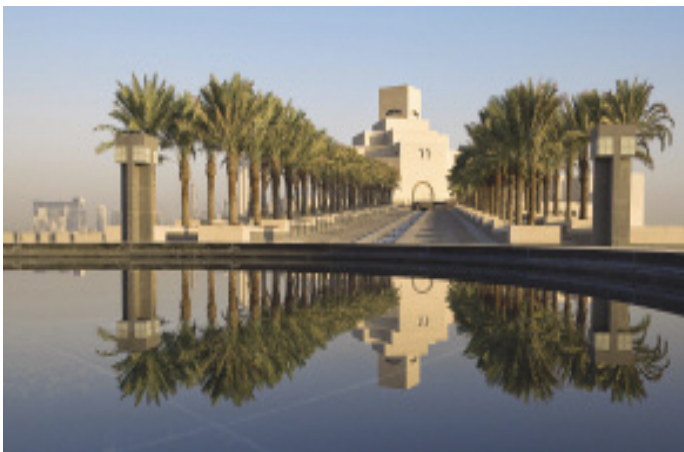
Rampe aus JET MIST-Granit

der Küste Dubais wurde kürzlich mit dem größten Feuerwerk aller Zeiten die Luxus-Insel »Palm-Jumeirah« eröffnet. Auf dem künstlichen Eiland in Palmform, das aus mehr als 100 Mio. m 3 Erde und 7 Mio. t Steinen aufgeschüttet wurde, sollen rund 30 Luxushotels und 1500 Privatvillen errichtet werden. Weitere spektakuläre Projekte entstehen in Abu Dhabi, wo u. a. der französische Stararchitekt Jean Nouvel bis 2012 für mehr als