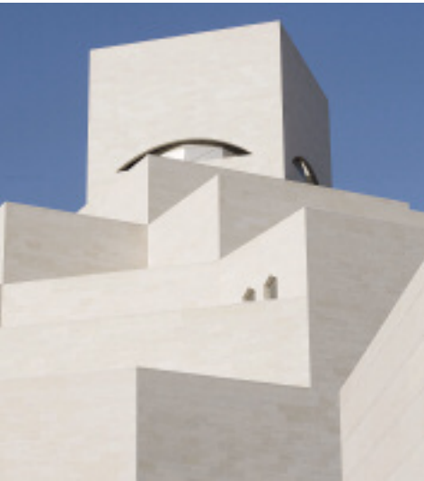
Komposition aus Kalkstein-Kuben: das Hauptgebäude