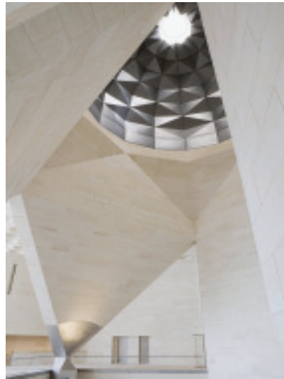
Lichtfang: Kalksteinwand und Öffnung in der Kuppel der 45 m hohen Halle