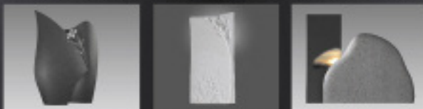
Die Modelle sind geschmacksmustergeschützt.

Zukunft Grabmal - Hausmesse + Stone+Tec 2009 (Erfahren Sie mehr zu unseren exklusiven Aktivitäten im Internet)