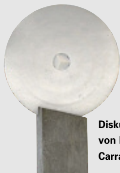
Diskus, Meisterstück von Boris Bartz, Carrara Marmor