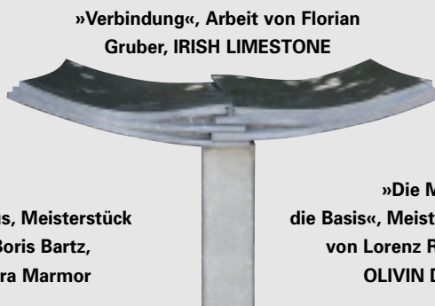
»Verbindung«, Arbeit von Florian Gruber, IRISH LIMESTONE