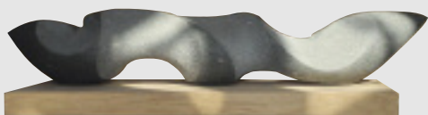
»Dynamik«, Arbeit von Konstantin Vetter, ANRÖCHTER DOLOMIT