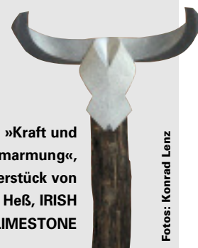
»Kraft und Umarmung«, Meisterstück von Christian Heß, IRISH LIMESTONE