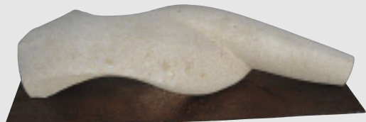
»Leichtigkeit«, Meisterstück von Frauke Witzel, MASSANGIS