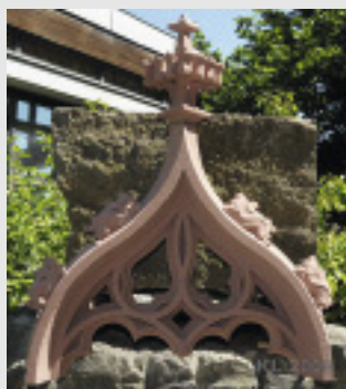
Hochgotischer Wimperg von Hannes Mutschler, WÜSTENZELLER SANDSTEIN