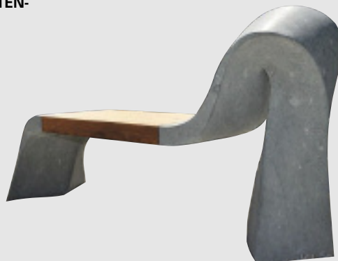
»Bank des Vertrauens«, Meisterstück von Christian Uhlig, ANRÖCHTER DOLOMIT