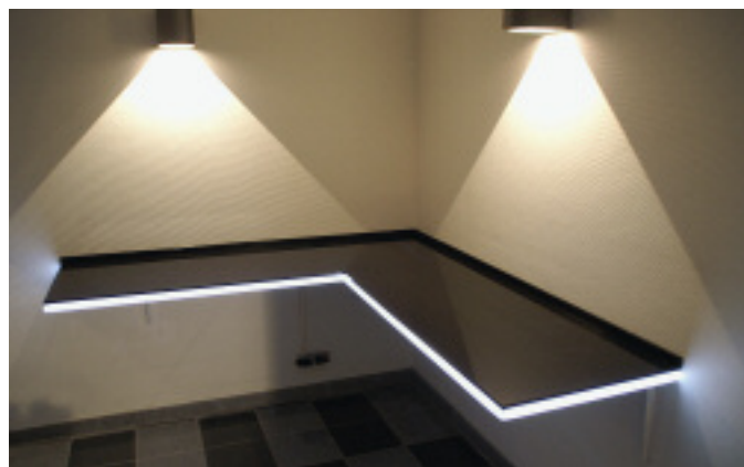
Besonderer Hingucker: Ein Lichtband läuft rund um die Küchenarbeitsplatte.

Wasserstrahlanlage für Formate bis 3 x 3 m. Ergänzt wird sie u. a. durch ein CNC-Bearbeitungszentrum und zwei Brückensägen. Auf ihnen verarbeiten die 20 Mitarbeiter von D+D – darunter ein halbes Dutzend Steinmetzen – heute Rohmaterial zwischen 1 und 4 cm Stärke. Die Standardmaterialpalette umfasst zwischen 16 (1-cm-Material) und 20 Granitsorten (Massivplatten). Rund ein Zehntel der verarbeiteten Rohtafeln entfallen mittlerweile auf Zodiaq und Caesar Stone, so Claas, der wie Bruder Jan geschäftsführender Gesellschafter ist. Der Anteil von Quarzverbundstoffen steige gegenwärtig noch. Für Zodiaq (93 % Quarz, 7 % eine spezielle Polymer-Pigment-Mischung) sei man einer der deutschen »Network-Partner«.