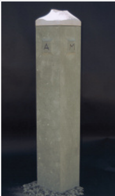
»Wüstendimensionen des Menschen« von Benjamin Ritter (Hessen), ANRÖCHTER DOLOMIT und THÜSTER SANDSTEIN