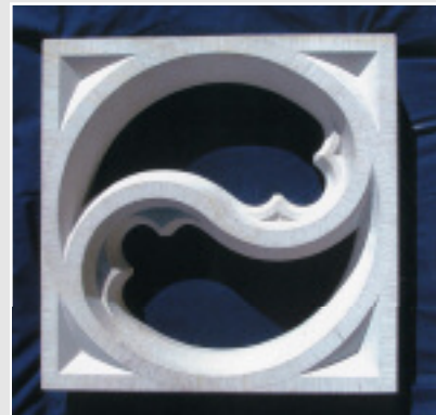
Zweischneuß von Rolf-Peter Fiebranz (Niedersachsen), OBERNKIRCHENER SANDSTEIN