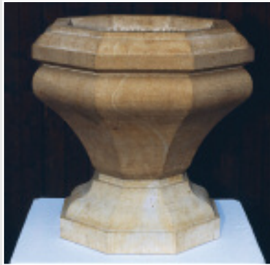
Blumenschale von Robert Rose (Thüringen), SEEBERGER SANDSTEIN