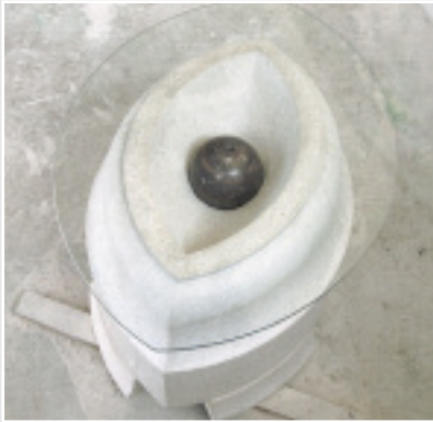
Beistelltisch von Patrice Langer (Bayern), UNTERSBERGER KALKSTEIN