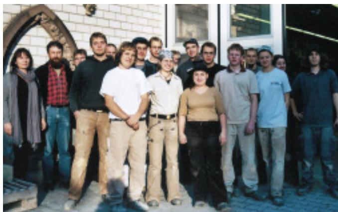
Die PLW-Teilnehmer mit den Juroren