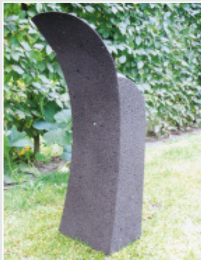
Bankfuß, Gesellenstück von Tobias Peeters, (Nordrhein-Westfalen), Basaltlava