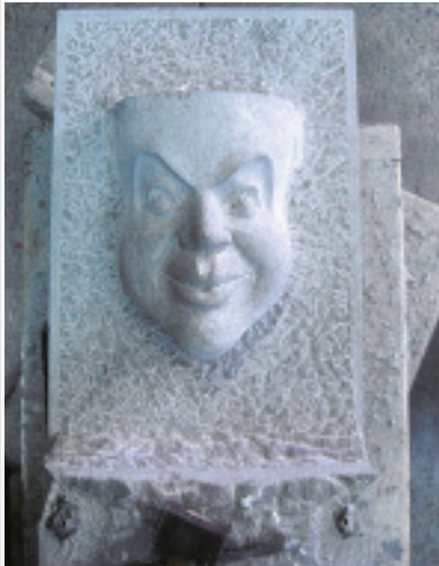
Fratze, Gesellenstück von Benjamin Scheiber (Bayern), ROHRSCHACHER SANDSTEIN