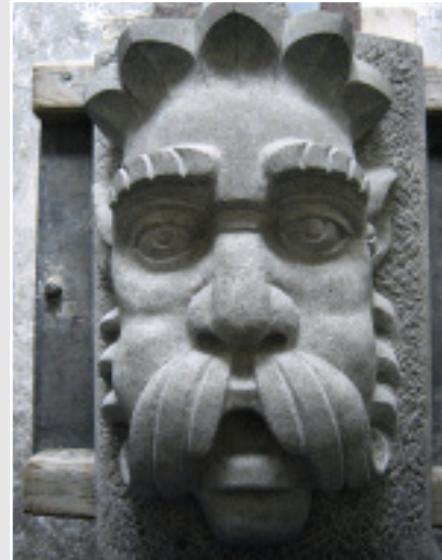
Wasserspeier von Jennifer Denk (Baden- Württemberg), PIETRA SERENA