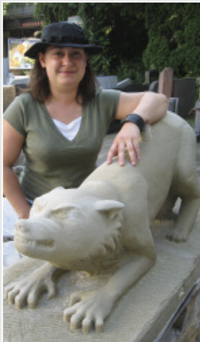
»Werwolf« von Cornelia Leineweber (Nordrhein-Westfalen), UDELFANGER SANDSTEIN